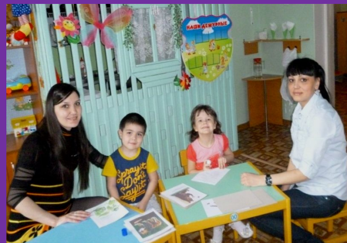
Консультация «Знаете ли вы своего ребенка?»