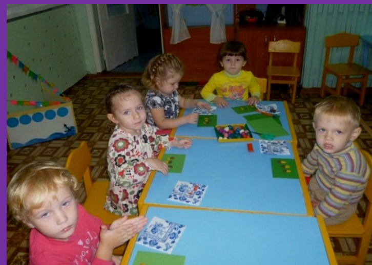
Арт - технологии