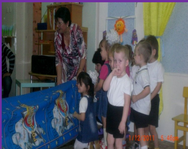
Спортивные досуг «Веселые старты» 2011