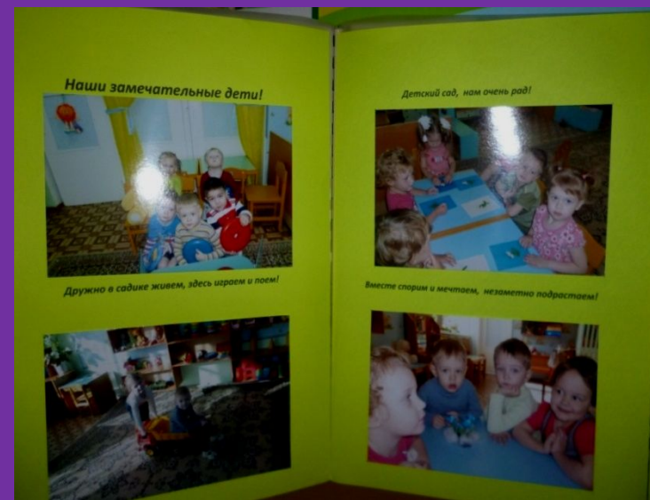
Игровые - технологии