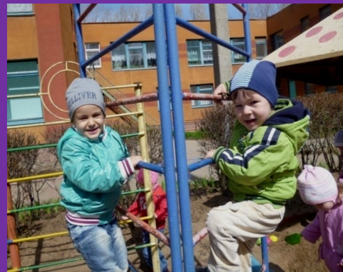
Здоровье сберегающие технологии