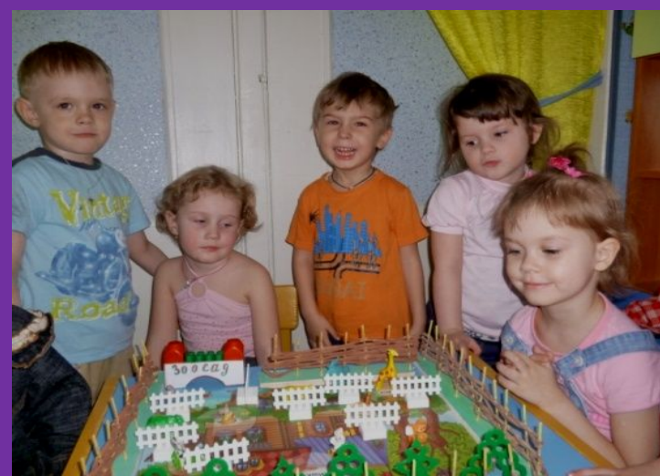
Технология игровой обучающей ситуации