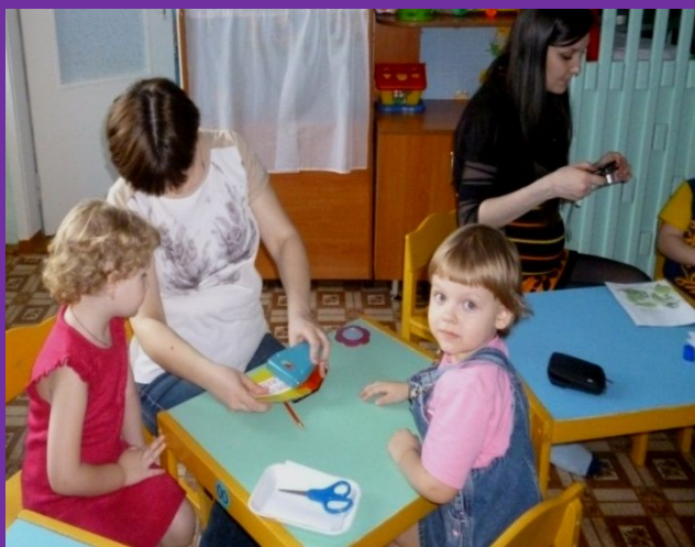
Родительский клуб «Мы вместе!» 2003