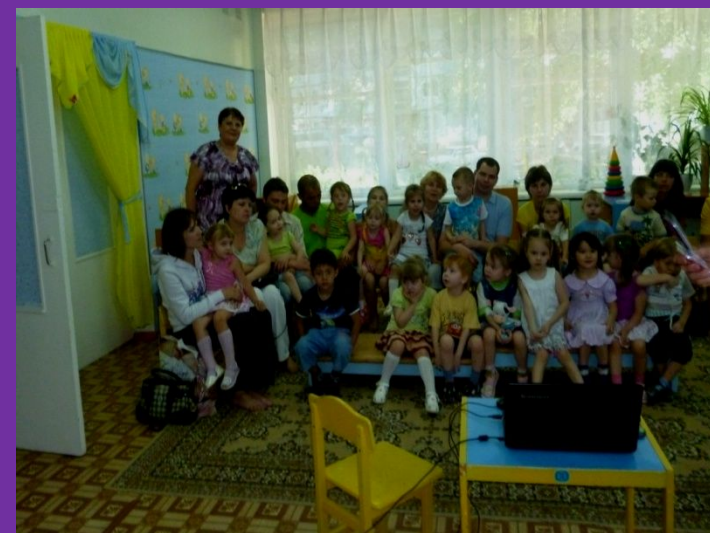
«Вот и стали мы на год взрослей!» 2011