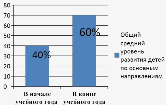
Диагностика знаний, умений и навыков 2018-2019 уч.год.