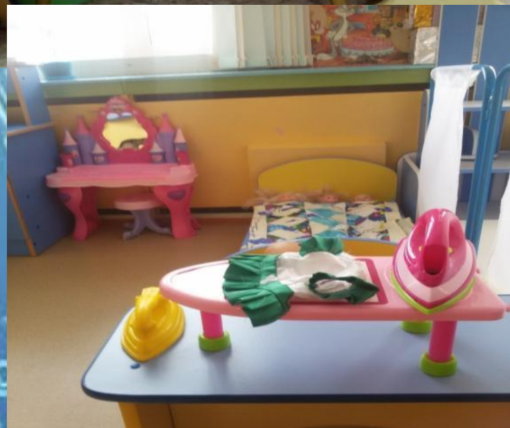
«Центр для девочек»