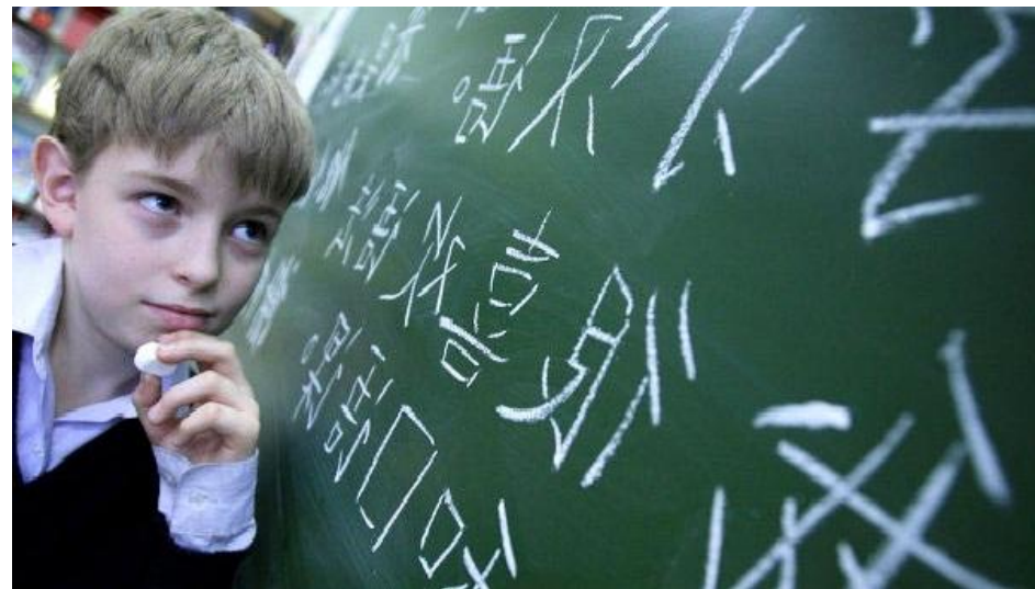
Изучаю китайский язык, 2013