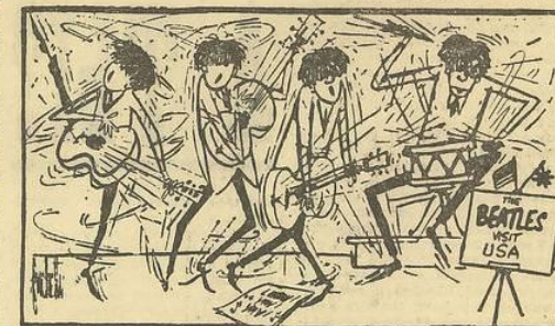
«Жуки» прибыли в Соединенные Штаты. Карикатура из газеты «Нью-Йорк геральд трибюн».