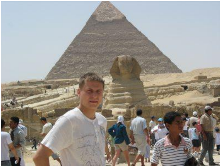
Летом в Египте, 2013