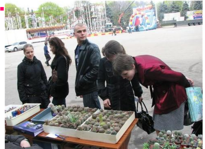
Развожу кактусы, 2013