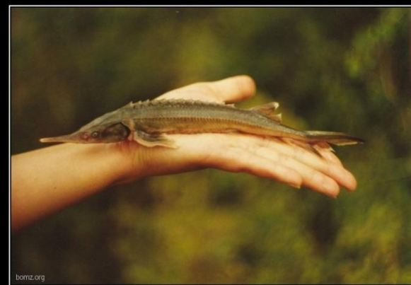
Я исчезаю. Сохрани меня! Стерлядь занесена в Международную Красную Книгу