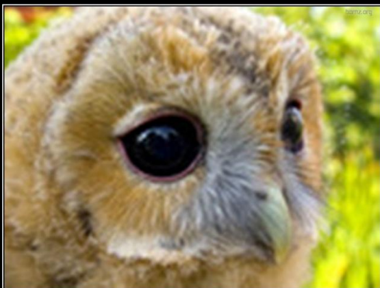
Я исчезаю. Сохрани меня! Орёл-карлик занесен в Красную Книгу Украины