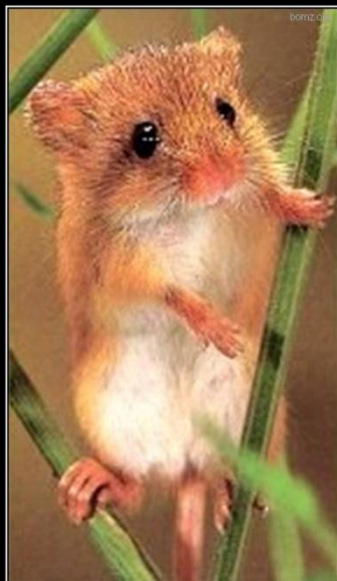
Я исчезаю. Сохрани меня!

Мышь-малютка одна из самых мелких млекопитающих на Земле