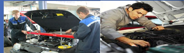
Основні несправності і т а т ехнічне обслуговування легкових авт омобілів

Департамент освіти і науки Чернівецької облдержадміністрації Глибоцький професійний ліцей