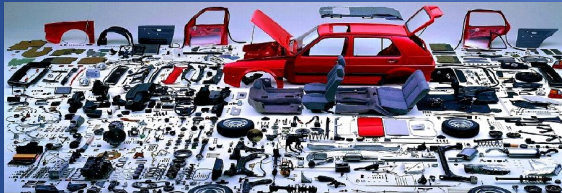
Основні несправності і т а т ехнічне обслуговування легкових авт омобілів

Департамент освіти і науки Чернівецької облдержадміністрації Глибоцький професійний ліцей