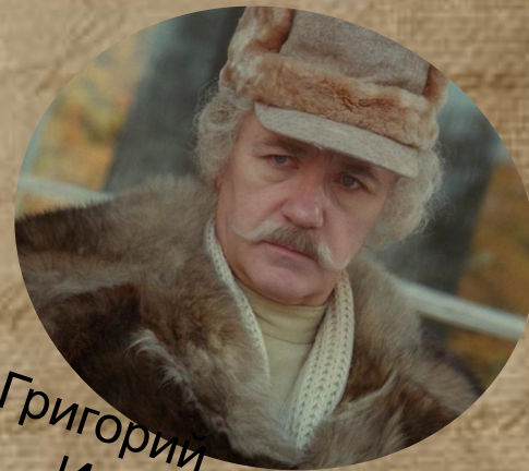
Григорий Иванович Муромский