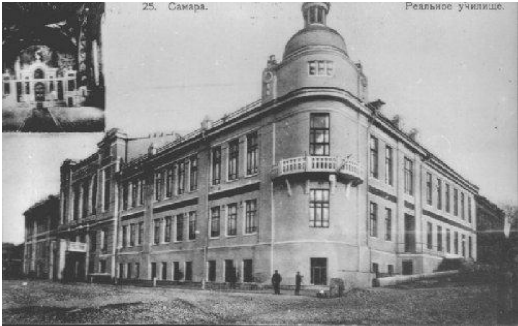
Самара, Реальное училище. Конец 19 века.