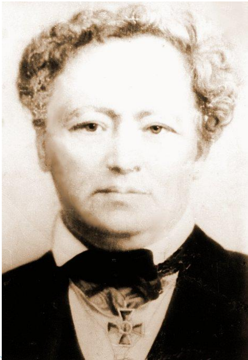
Григоров А. Н. (1799—1870) Основатель Григоровской женской гимназии в г. Костроме.