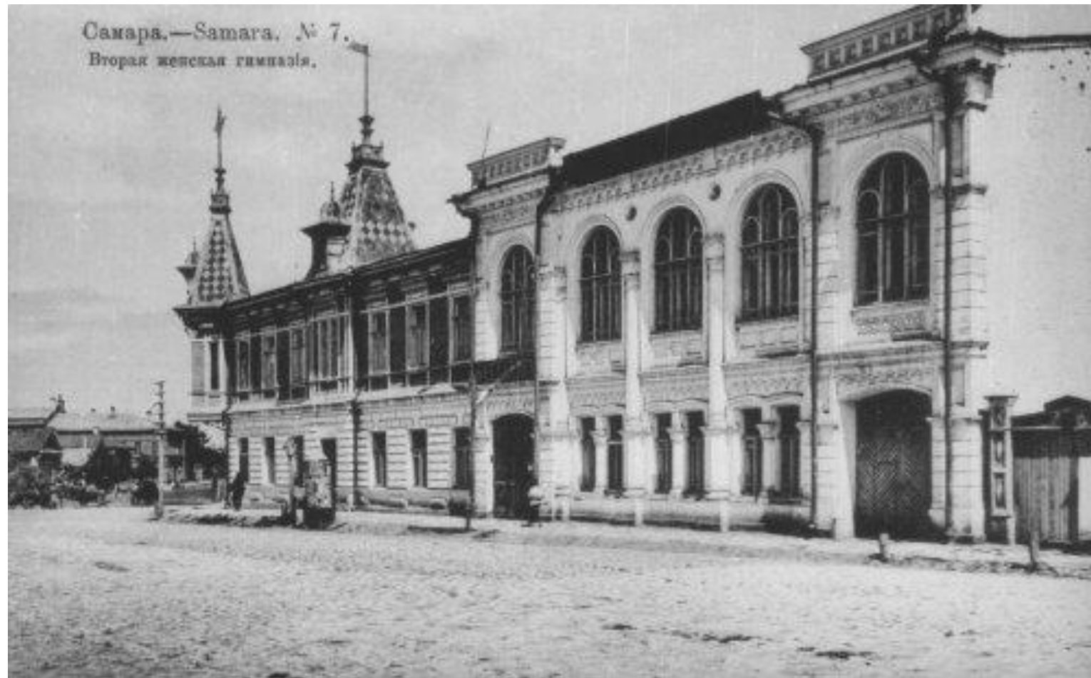
Самара.—Samara. № 7. Вторая женская гимназия.