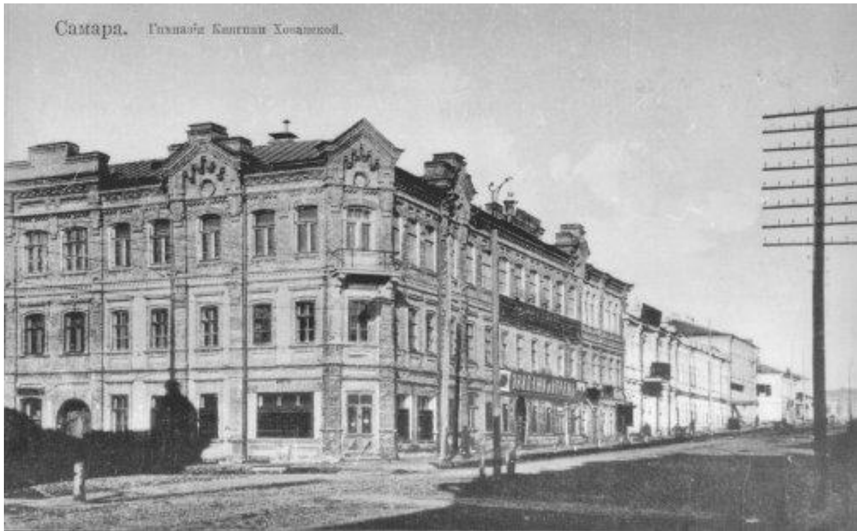
Самара, Гимназия Хаванской. 1910 год.