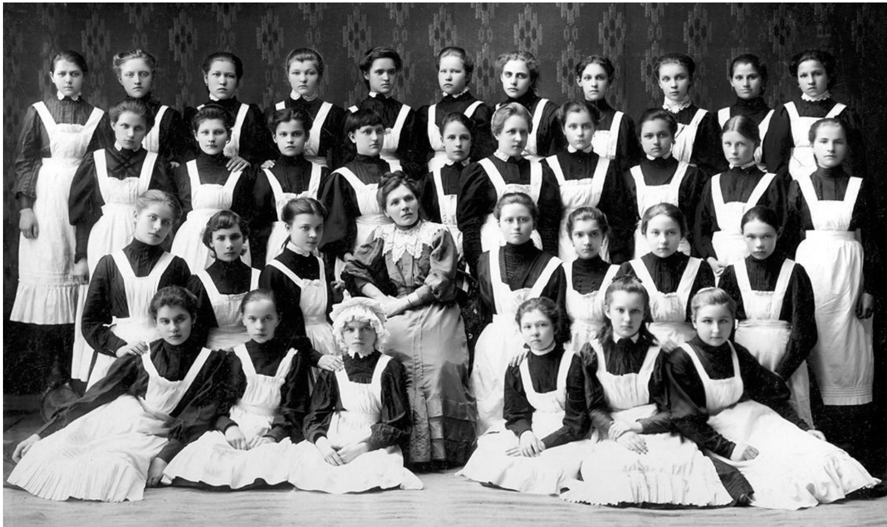
Бугурусланская женская гимназия. г.Бугуруслан. 1908 г.