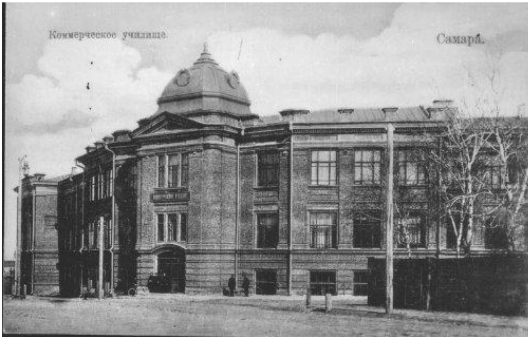
Самара, Коммерческое училище. Конец 19 века.