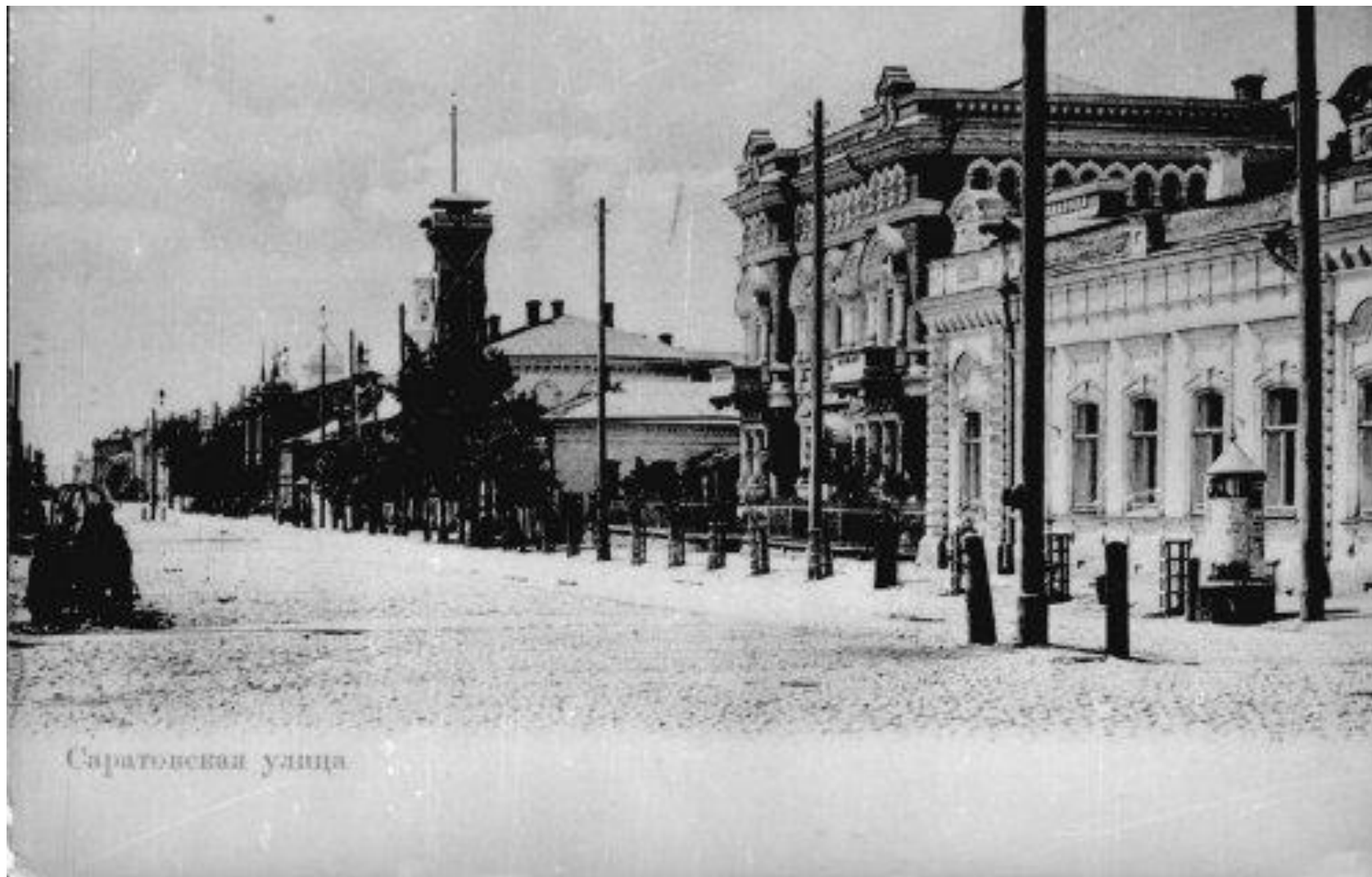
Самара, Саратовская улица