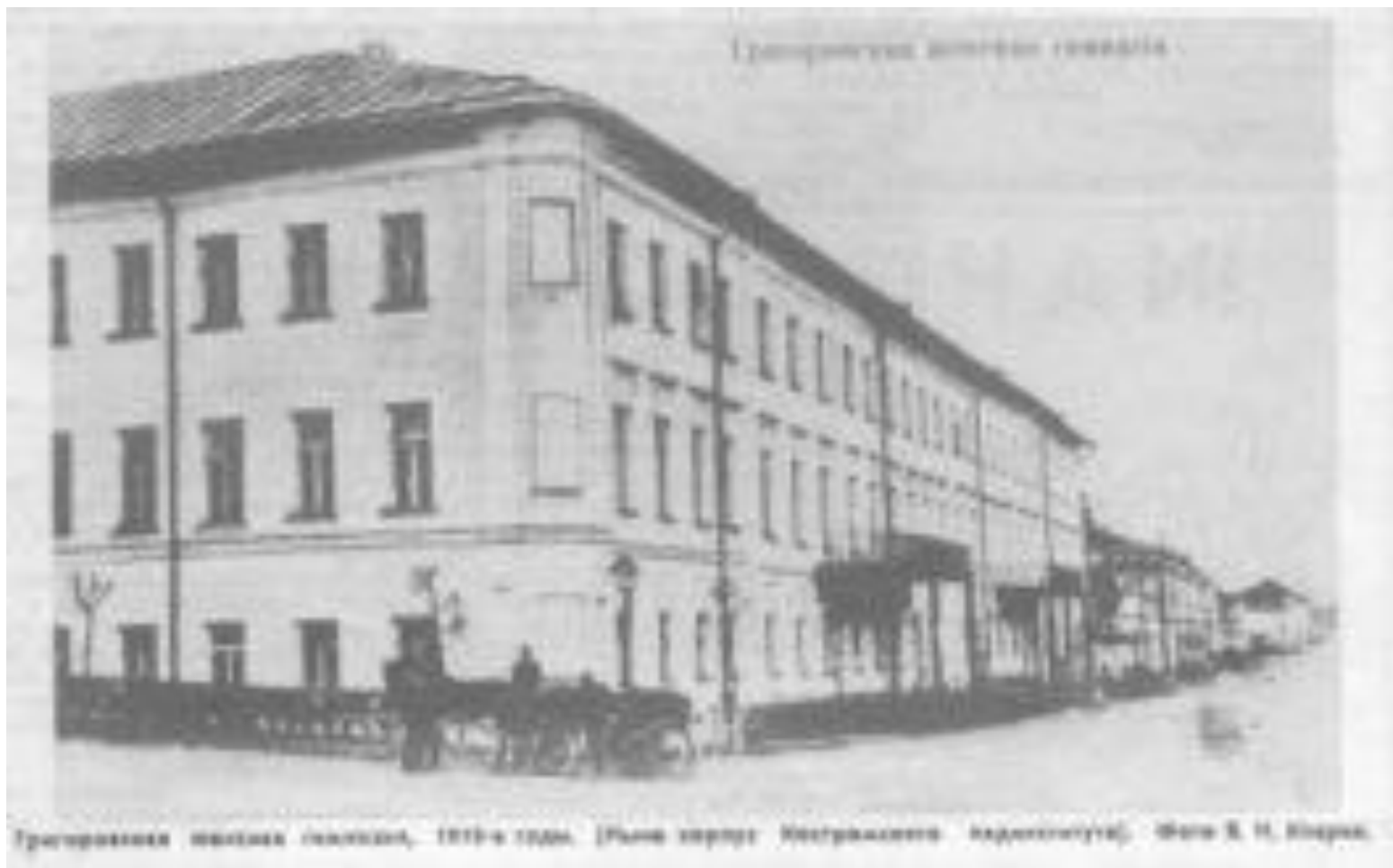
Григорьевская женская гимназия. Кострома. Конец 19 века.