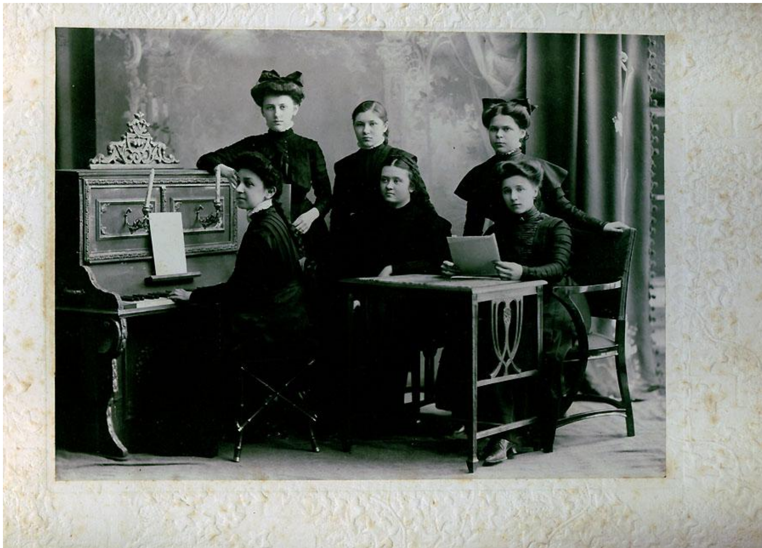
Урок музыки. Начало 20 века.