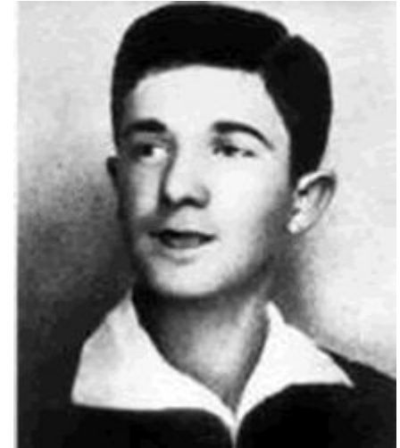
Mordechaj Anielewicz (1919 –1943)