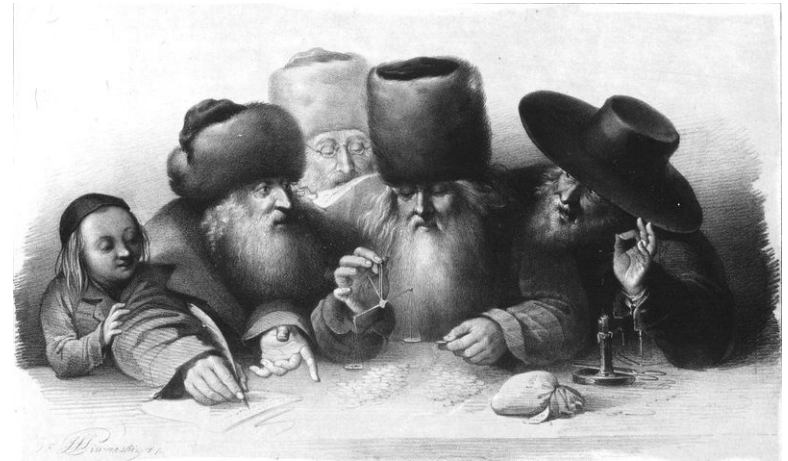
Židovští obchodníci v 19. stol. ve Varšavě.

Tento vzestup byl zapříčiněn pogromy v Rusku v 80. letech 19. století, po kterých do Polska přicházejí Židé z Litvy, Běloruska, Ukrajiny.