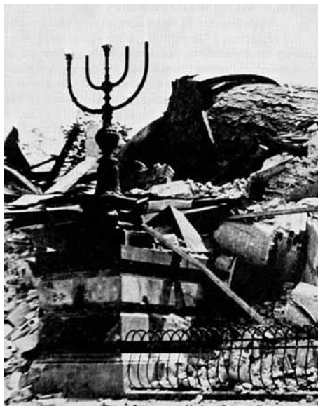
Ruiny tzv. Velké varšavské synagogy

Teprve 16. května 1943 prohlásil německý velitel likvidace ghetta Jürgen Stroop akci za ukončenou a na znamení vyhlazení varšavských Židů nechal strhnout velkou varšavskou synagogu , která stála mimo ghetto.