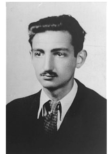
Marek Edelman (1922 –2009)