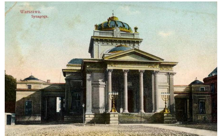
Varšavská Velká synagoga