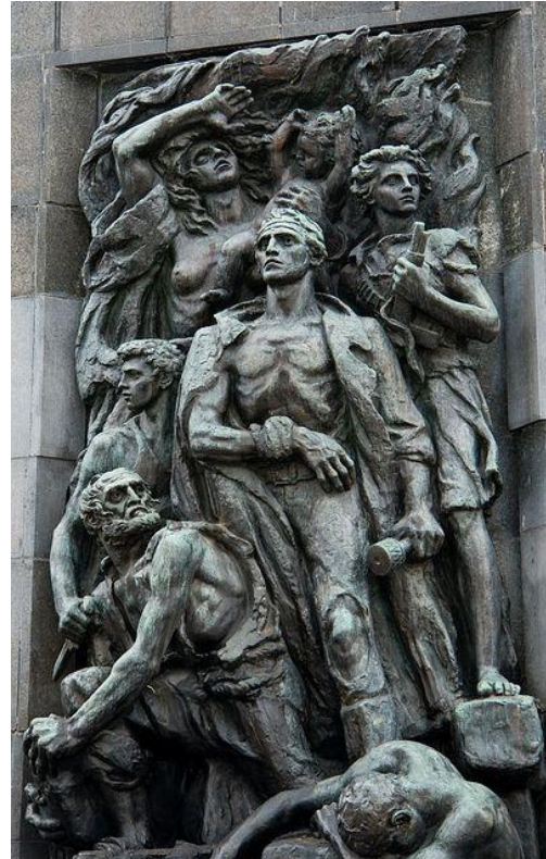
Monument bojovníkům ghetta ve Varšavě

Nejmladší z bojovníků při povstání byl ročník 1925, nejstarší 1908. Oba zemřeli první den povstání.