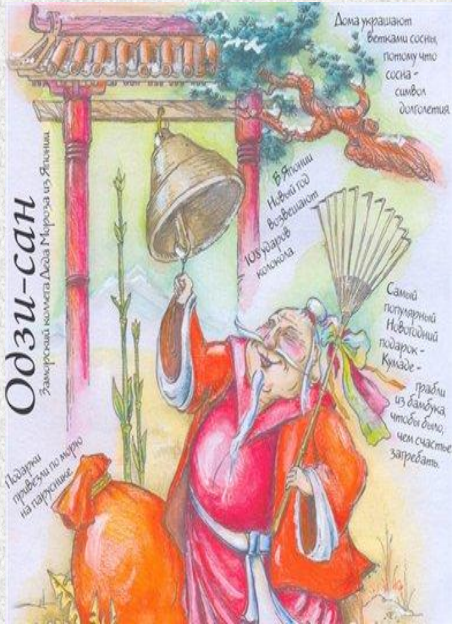
Одзи-сан - Япония