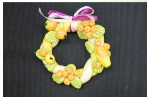
«Пасхальный венок», Египко Семен