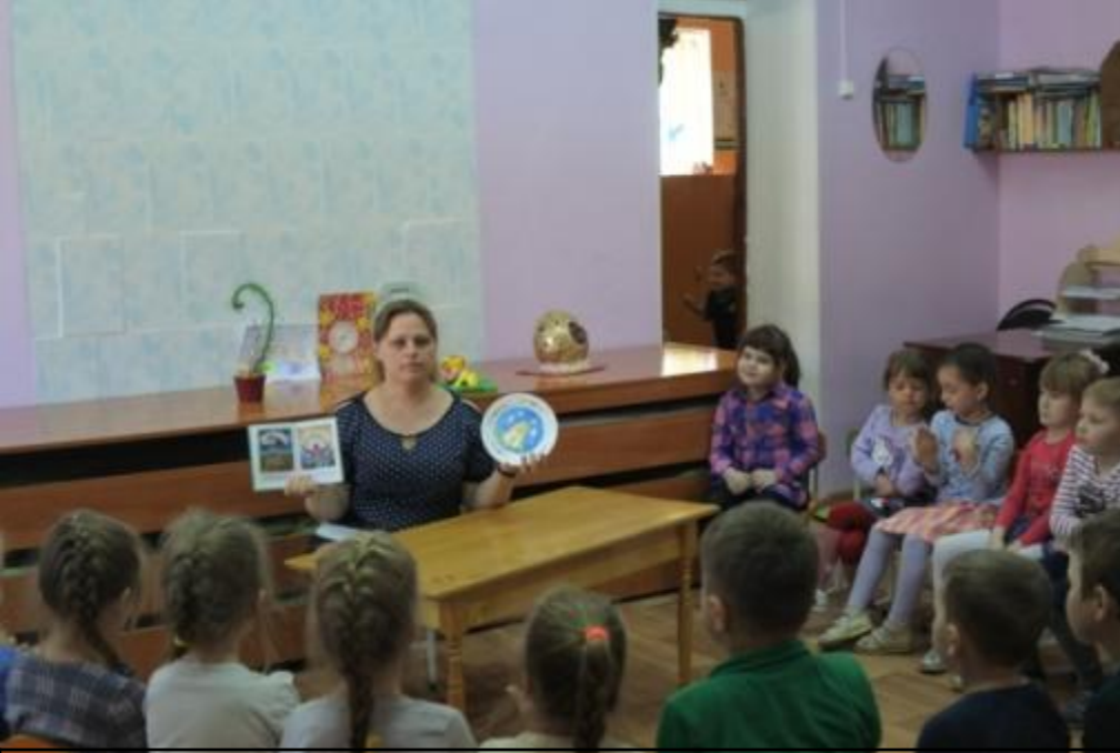
Рисуем «Пасхальный кулич»