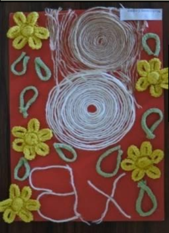
«Пасхальная вышивка», Майданюк София