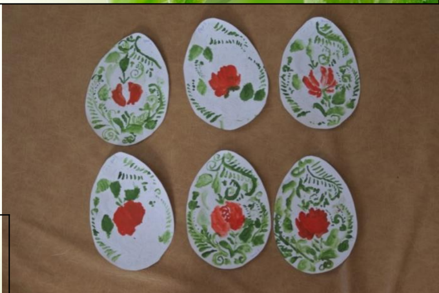
Роспись пасхального яйца под «Гжель»