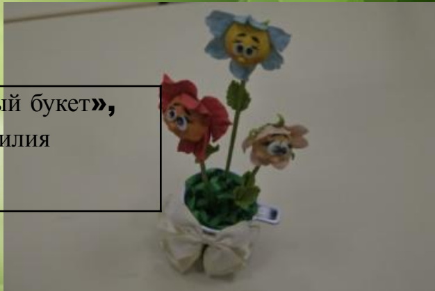
«Пасхальный букет», Потапова Лилия