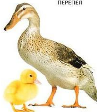
УТКА И УТЁНОК