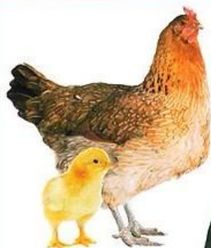
КУРИЦА И ЦЫПЛЁНОК