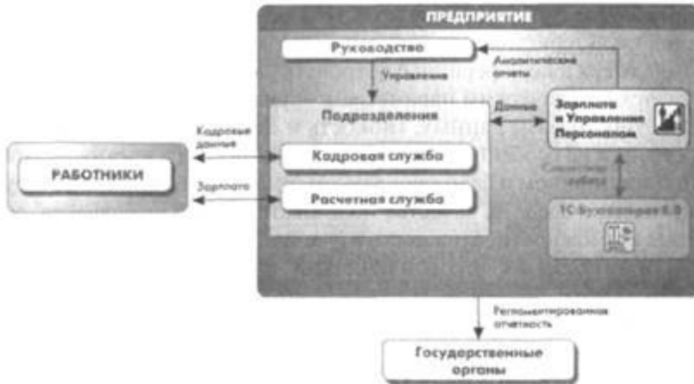
Рис. 6.11. Предметная область, автоматизируемая прикладным решением «1С:Зарплата и Управление Персоналом 8.0»