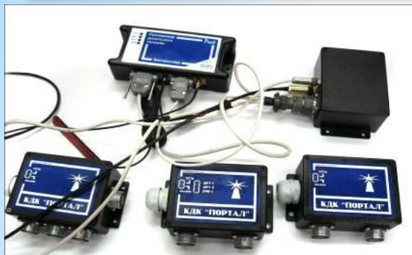
Датчики контроля топлива, температуры, давления и т. п.