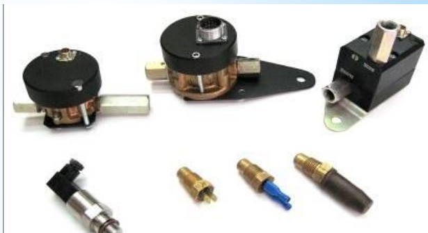
Электронный блок управления