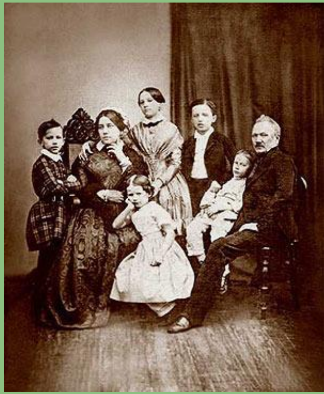
Семья Чайковских в 1848 году (крайний слева — Пётр Ильич)

Русский композитор, дирижёр, педагог, музыкально-общественный деятель, музыкальный журналист.