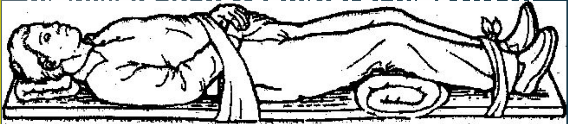
Мал. 10. Підготовка до транспортування хворого з переломом хребта

хребта. У таких випадках необхідно обережно, не піднімаючи потерпілого, підсунути