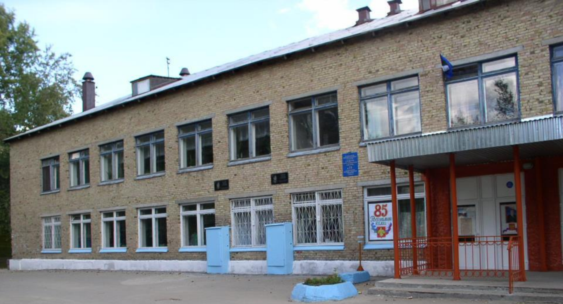
МАОУ СОШ № 35 с углубленным изучением отдельных предметов г. Сыктывкара