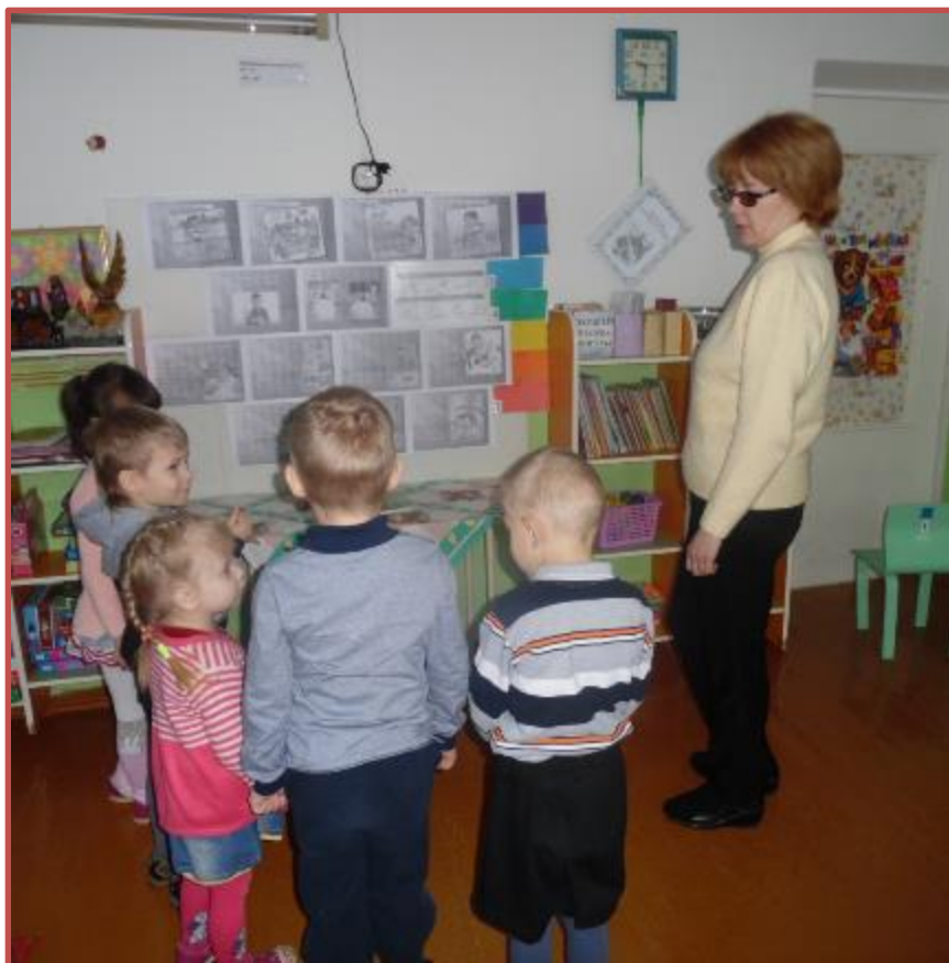
Рассматривание иллюстраций «Как правильно себя вести за столом»