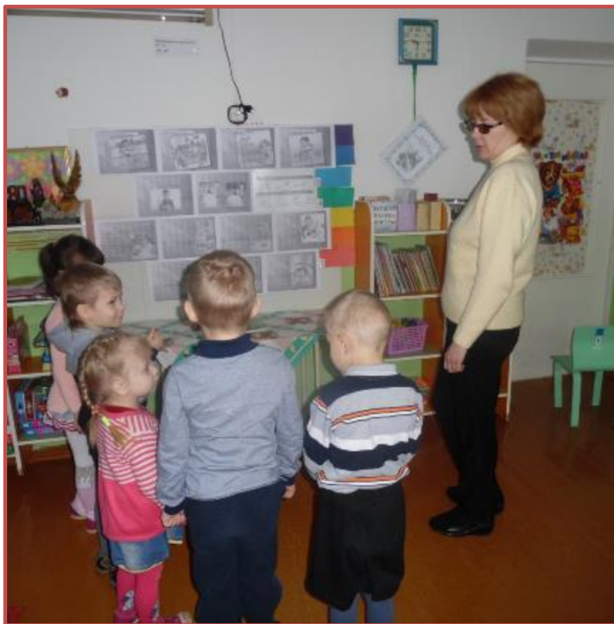
Рассматривание иллюстраций «Как правильно себя вести за столом»