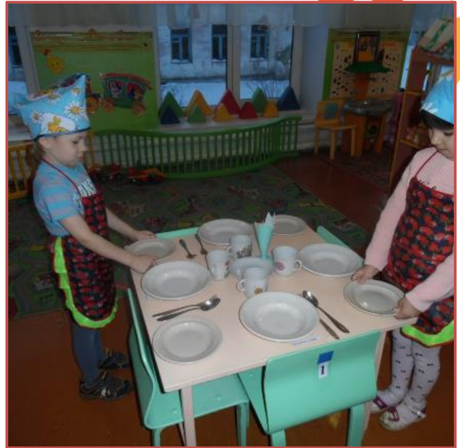
Сервировка стола к обеду