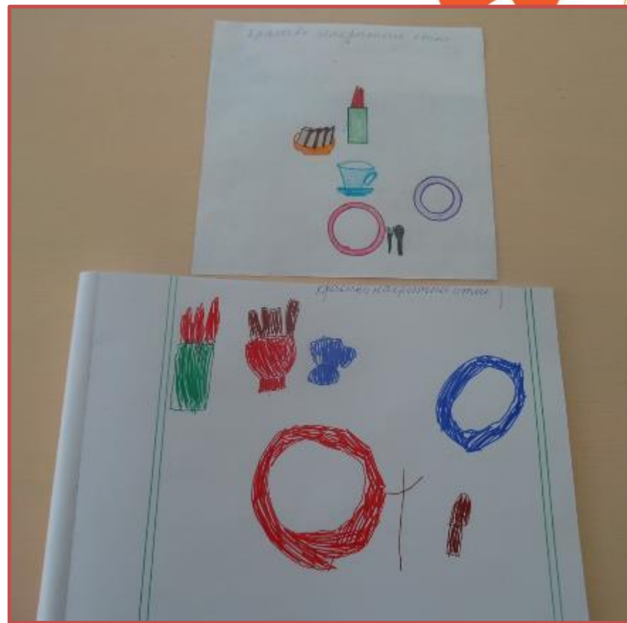
Красиво накрытый стол