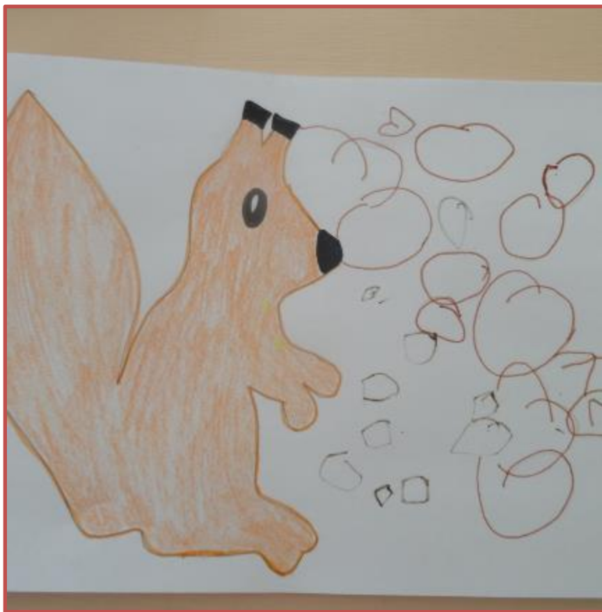
Угостим белочку орешками