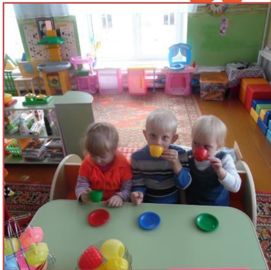
Д/И «Встреча гостей»