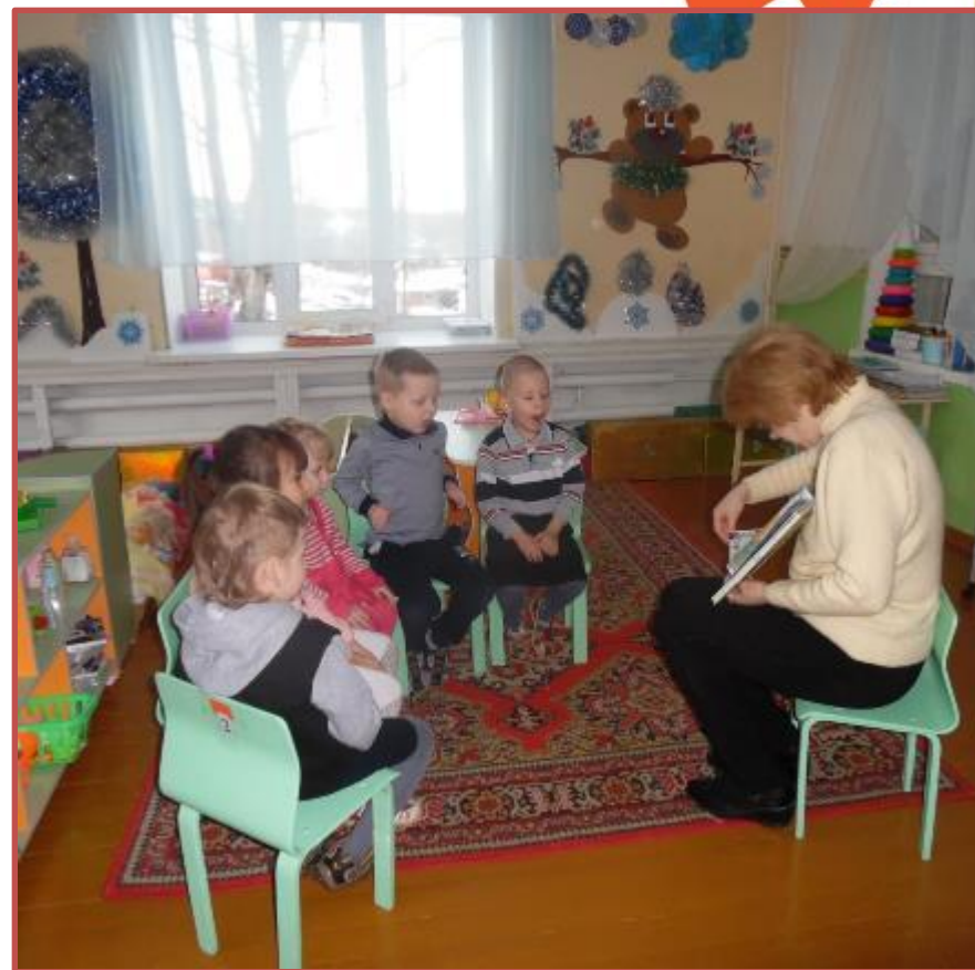
Рассматривание иллюстраций «Что такое хорошо, что такое плохо»