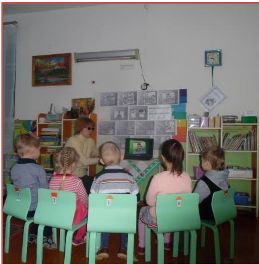
Беседа «Правила поведения за столом»