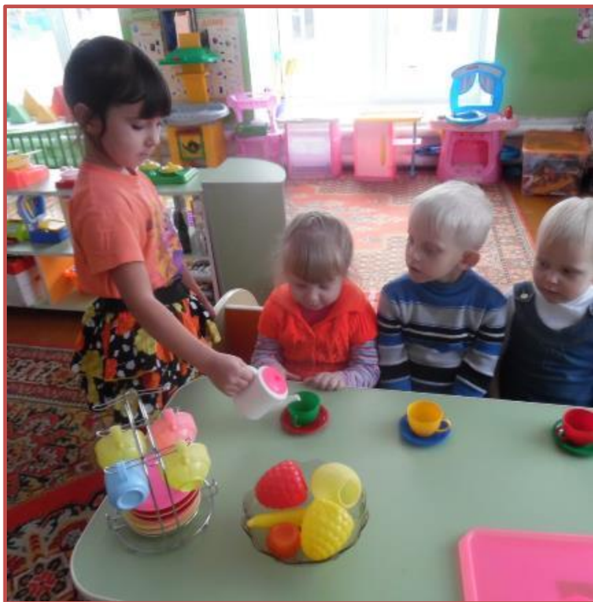
Д/И «Встреча гостей»