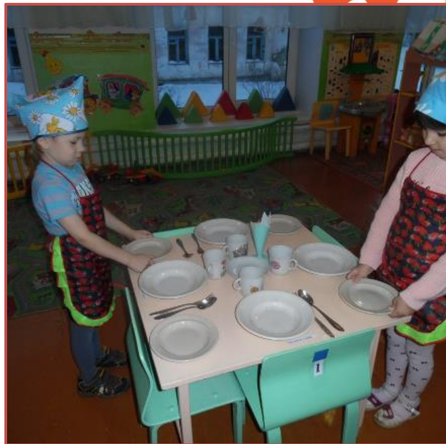
Сервировка стола к обеду