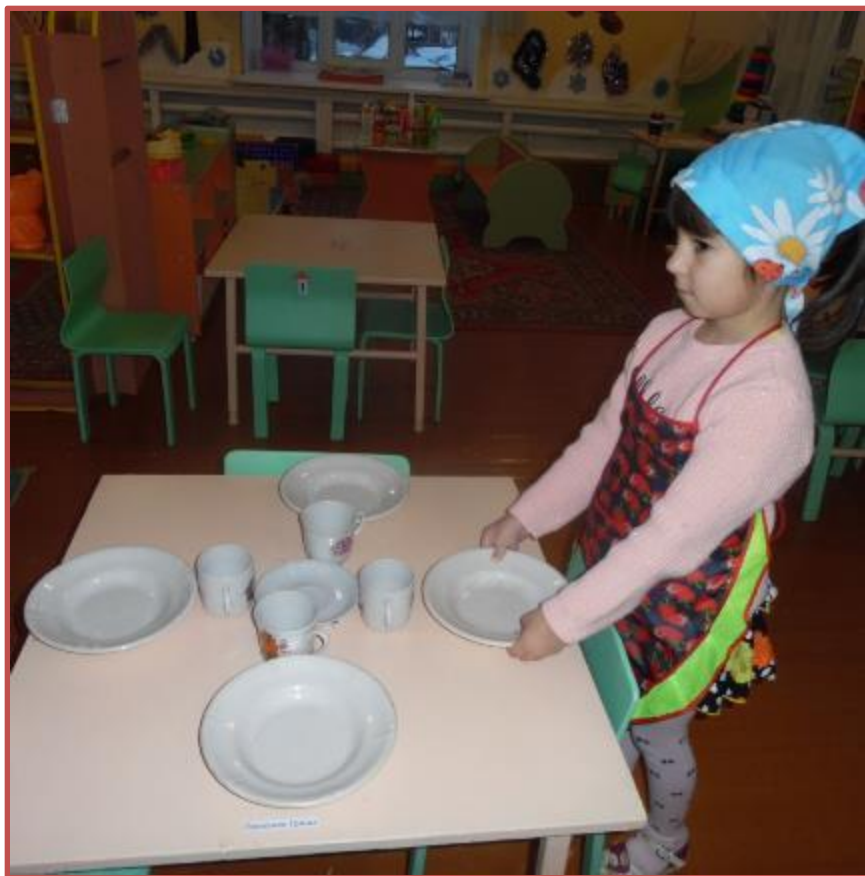
Сервировка стола к завтраку