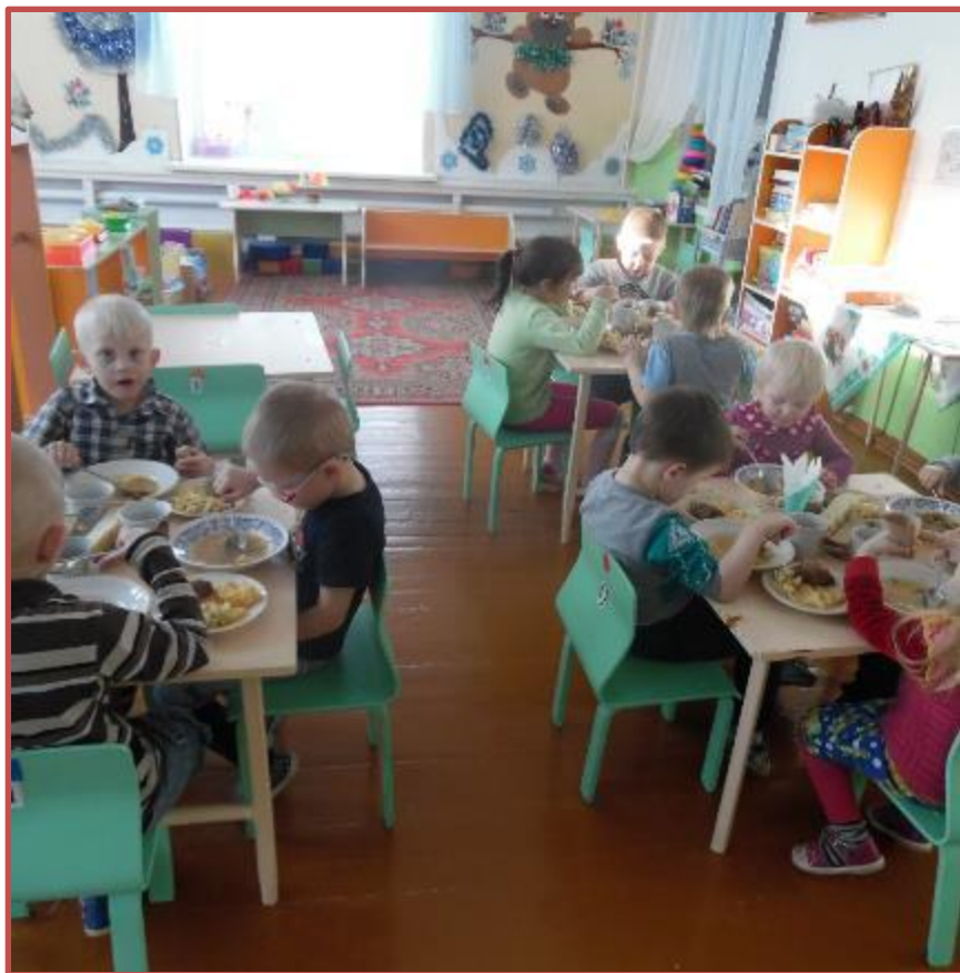
Час обеда подошел сели дружно все за стол.