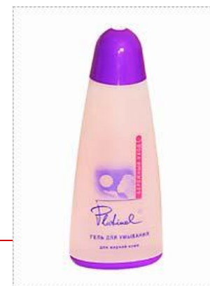
Гель для умывания