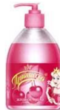
Жидкое детское мыло