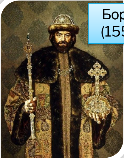
Борис Годунов (1552-1605 гг.)

Федор Иоаннович не интересовался государственными делами, поэтому от его имени управлять государством стал боярин Борис Годунов , брат жены царя