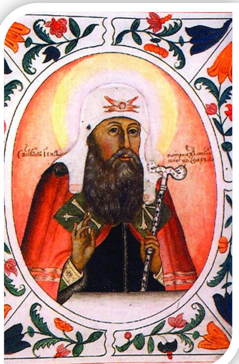
Патриарх Иов (1525-1607 гг.)

Тем самым РПЦ стала самостоятельной и независимой от греческой, тем самым укрепило влияние как внутри страны, так и за рубежом.