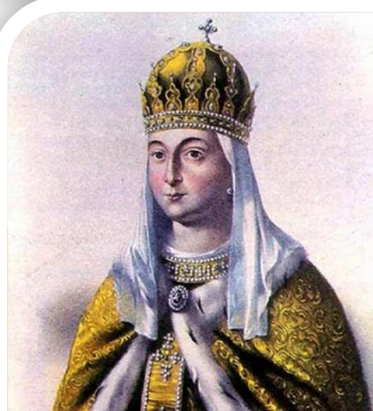
Мария Нагая, жена Ивана IV