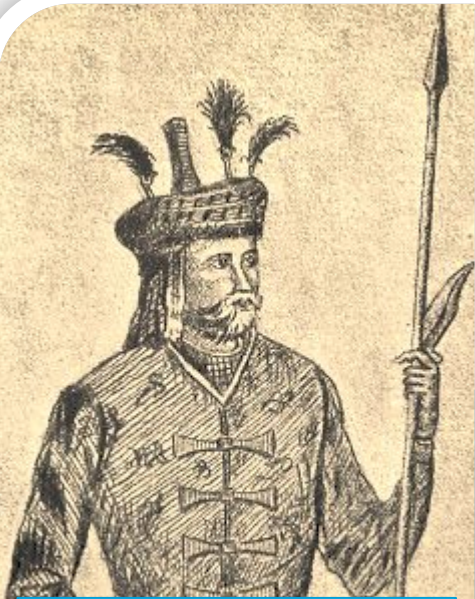
Александр II, царь Кахетии (Грузии)

Россия постепенно восстановила свой международный авторитет