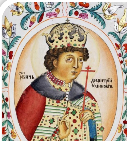
Дмитрий Иоаннович, младший сын Ивана