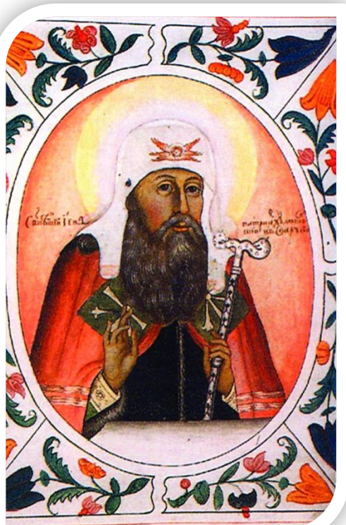
Патриарх Иов (1525-1607 гг.)

Тем самым РПЦ стала самостоятельной и независимой от греческой, тем самым укрепило влияние как внутри страны, так и за рубежом.