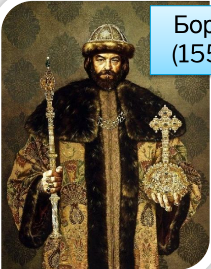
Борис Годунов (1552-1605 гг.)

Федор Иоаннович не интересовался государственными делами, поэтому от его имени управлять государством стал боярин Борис Годунов , брат жены царя