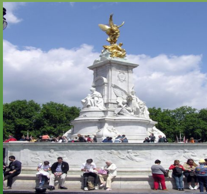
Меморіал на честь королеви Вікторії (Лондон)

Вважається часом найвищого розквіту британської держави, піднесенням економічного розвитку та добробуту суспільства, розквітом культури та мистецтв. Словосполучення «Вікторіанська епоха» ввійшло в британську та світову культуру як сталий прозивний вираз. На відміну від Єлизаветинської епохи, королева Вікторія на політичні процеси власне майже ніякого впливу не мала, а сама держава Британія, на відміну від інших європейських країн, обминула соціальні потрясіння та революції цього часу.