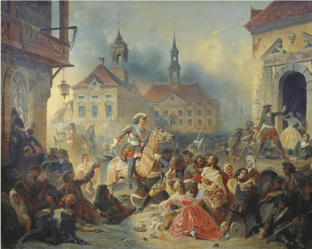
Петр I умирляет своих солдат при взятии Нарвы в 1704 году

Теперь в руках Петра оказались все течение Невы, Карелия, значительная часть Прибалтики. На всех направлениях шведы отступали.