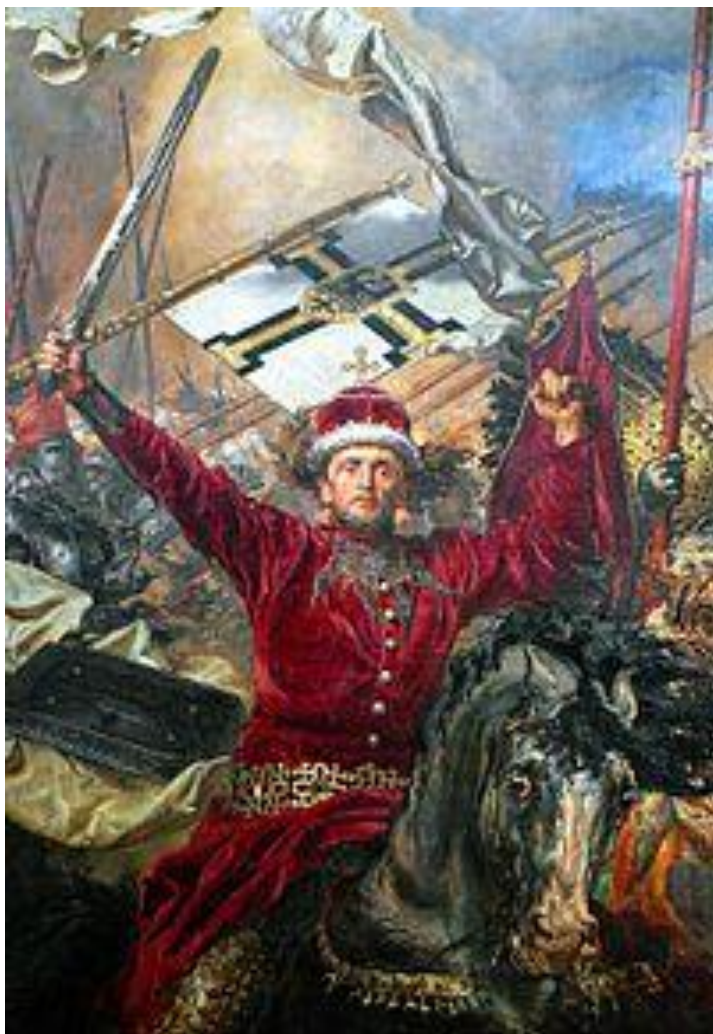
Ян Матейко. «Грюнвальдская битва» , 1878. Фрагмент картины, изображающий Витовта