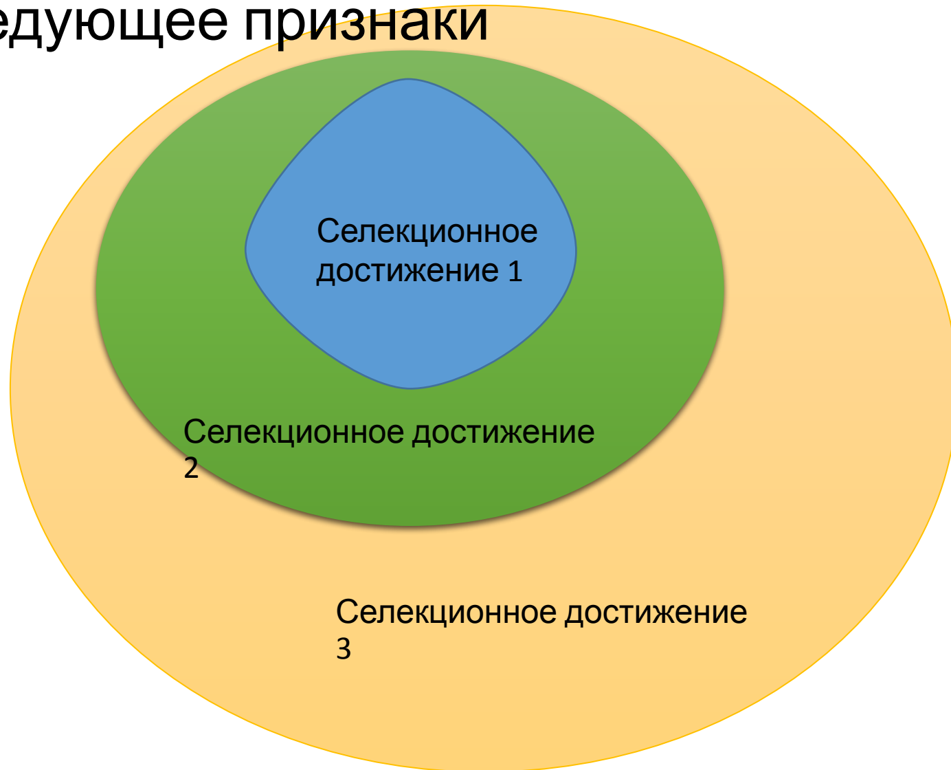
Схема. Селекционное достижение, существенным образом наследующее признаки