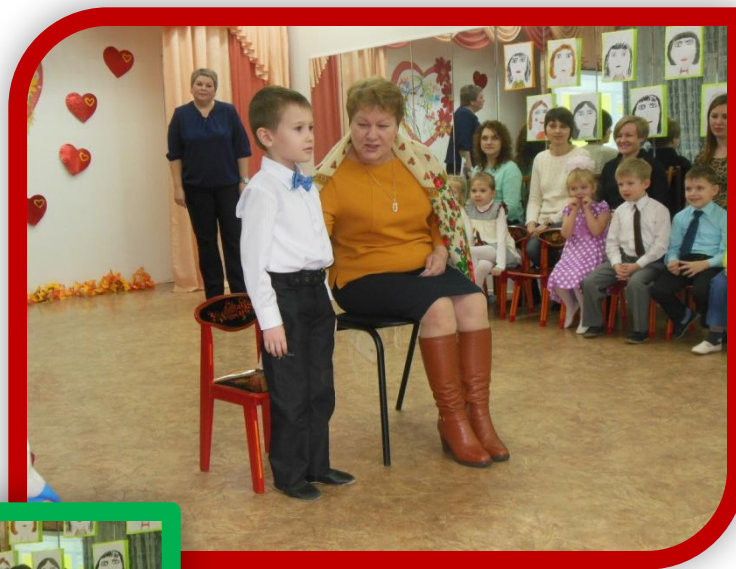
сценка «Бабушка и внук»