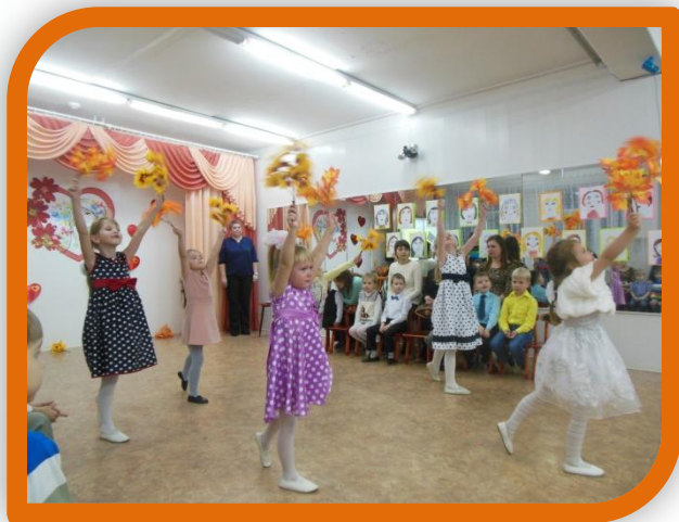
Танец с листочками