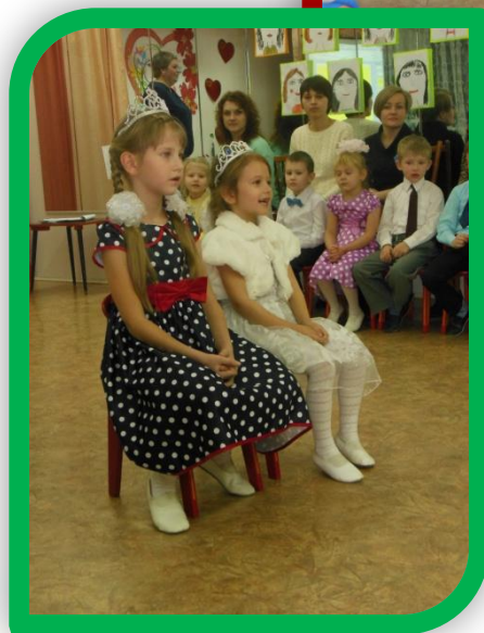
сценка «Кабы я была царица»