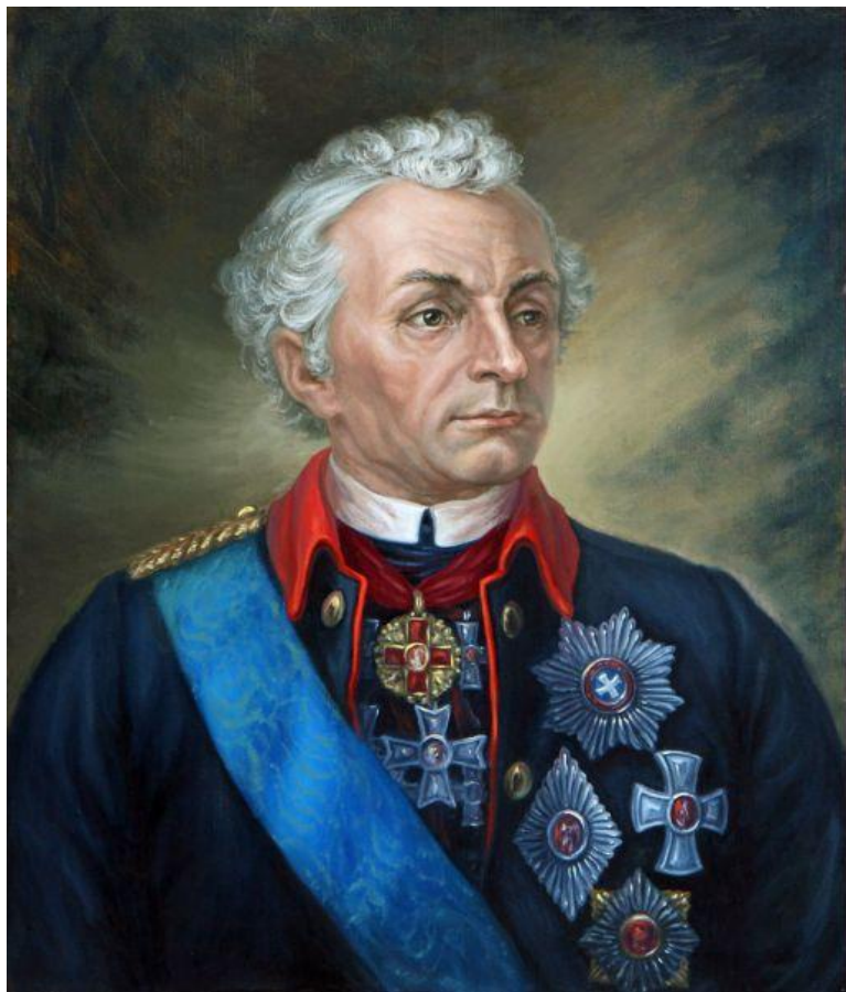
Александр Васильевич Суворов