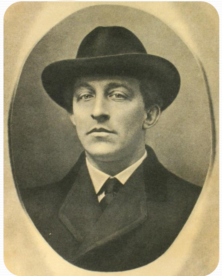
А. А. Блок

В воскресенье вербное Завтра встану первая Для святого дня.