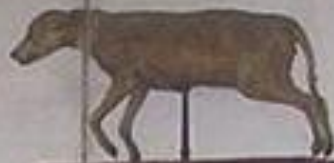
Собака породы гладкошерстный терьер по кличке Лизотта