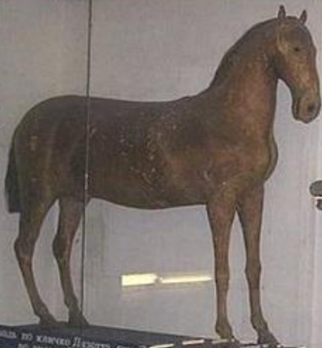
Лошадь по кличке Лизотта, служившая Петру I во время Польско-шведской войны.