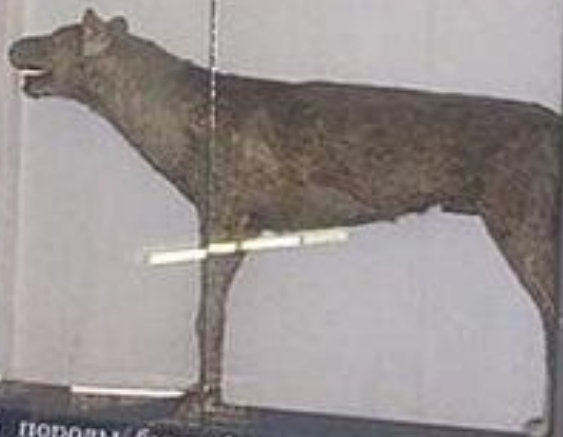
Собака породы буленбейсер /быкодав/ по кличке Тиран.

ИЗ ПЕРВЫХ ЭКСПОНАТОВ КУНСТКАМЕРЫ 1716-1725г.г.