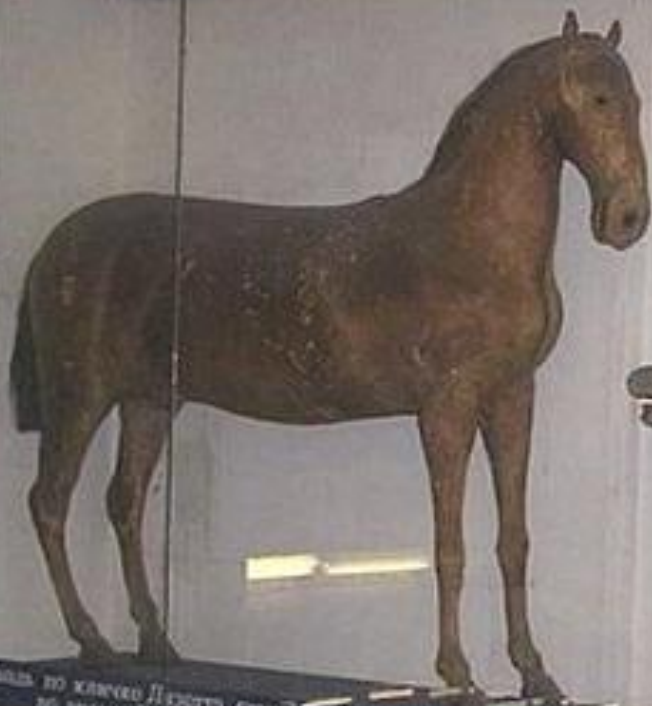
Лошадь по кличке Лизотта, служившая Петру I во время Польской битвы.