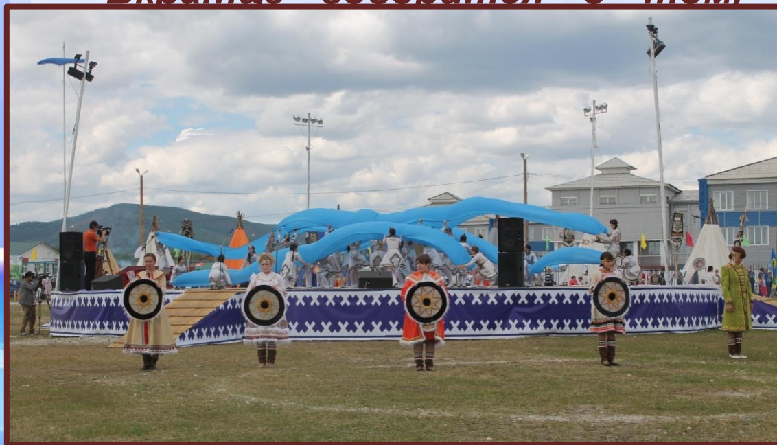
Больдер, 2013 год

Вкратце говорится о том, что прародителем Девушка слыла вным-давно похитил очень доброй и почитала всех зверей.