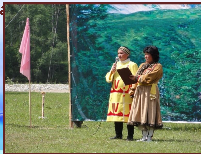
Праздник Аргамчи-Ыры, 2012 год