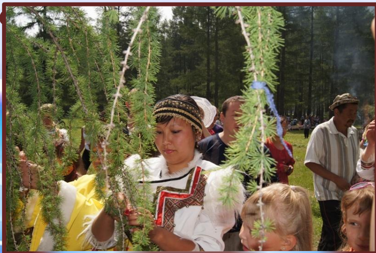
Вязание ленточек на счастье (ритуал праздника, 2012 год)

Если раньше спортивное состязание включало в себя бег, а бегунья бежала на беговых лыжах.