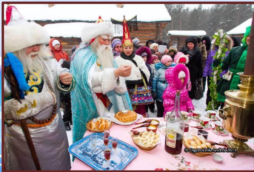
Сагаалган, 2014 год

Главный - это традиционный новый год - Сагаалган. При советской власти он назывался «белый месяц», а теперь и вовсе «Новый год», хотя старое название все еще помнят и даже иногда употребляют.