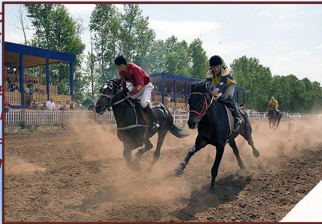
Сурхарбан, 2008 год

В настоящее время кроме соревнований на Сурхарбане проходят выступления артистов, возобновились молебны лам, для которых устанавливают специальные юрты, люди одевают красивые национальные одежды, и каждый празднует, как умеет.