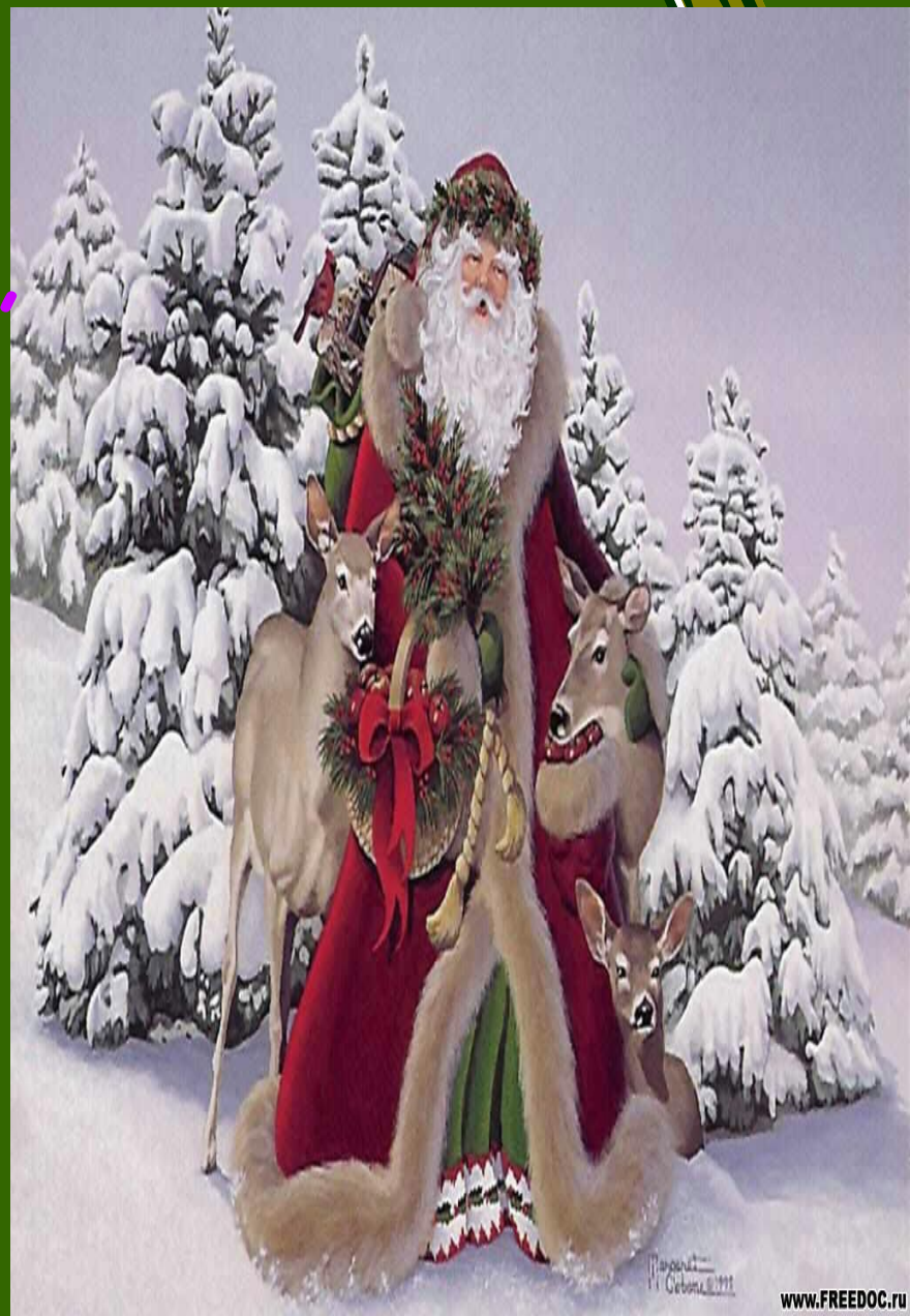
Иллюстрация © Сибирь, 2011