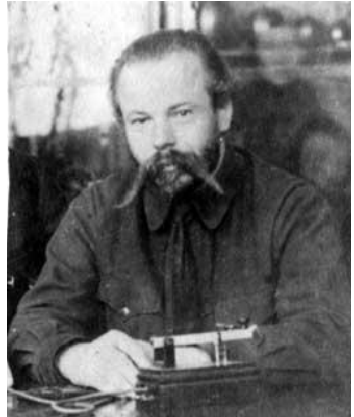
Рис. 10. К.Н. Корнилов. 1920-е гг.