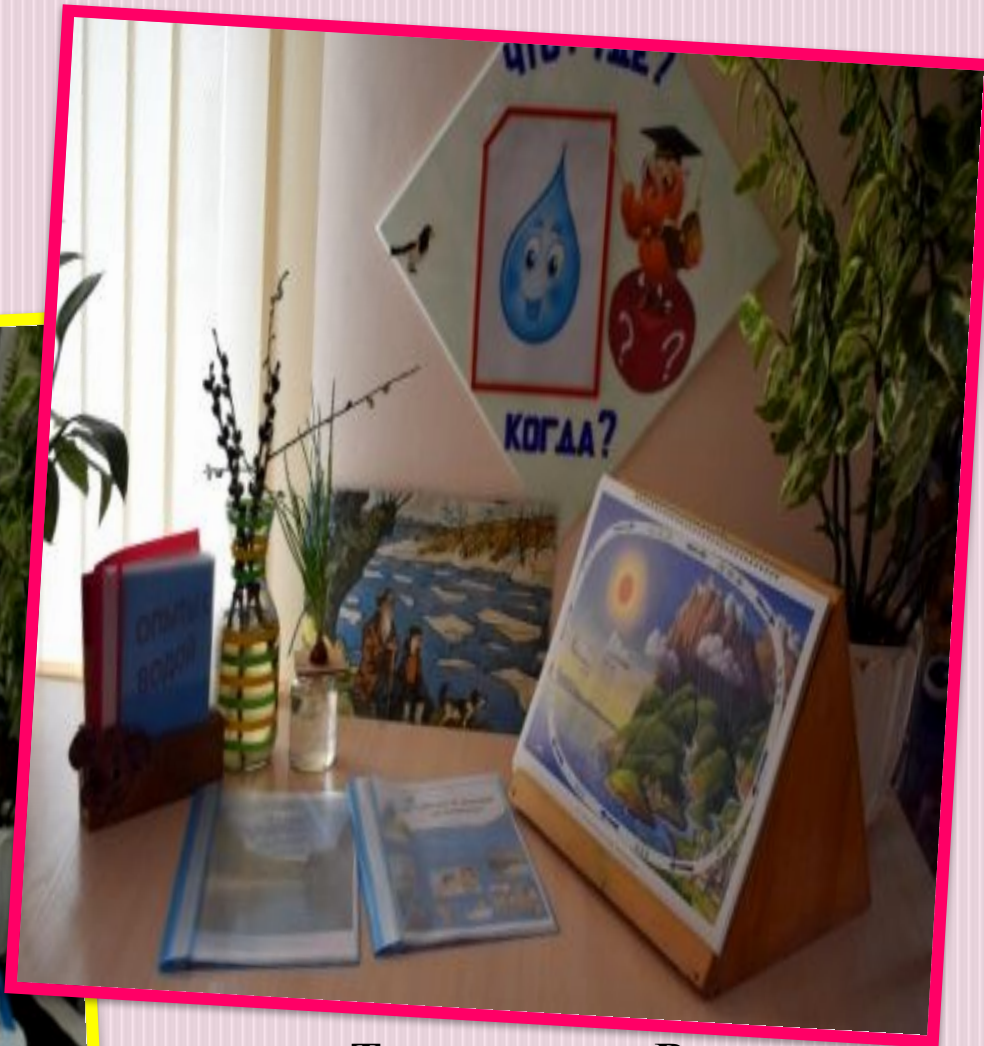
Тема недели «Вода»

Материал в центрах пополняется и обновляется соответственно тематическому планированию и возрасту детей.