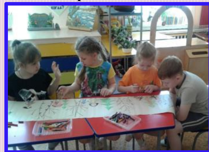
Коллективный рисунок по теме недели «Мой край родной»