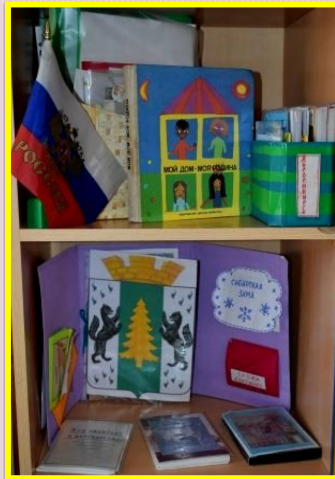
Материалы по теме недели «Мой город»