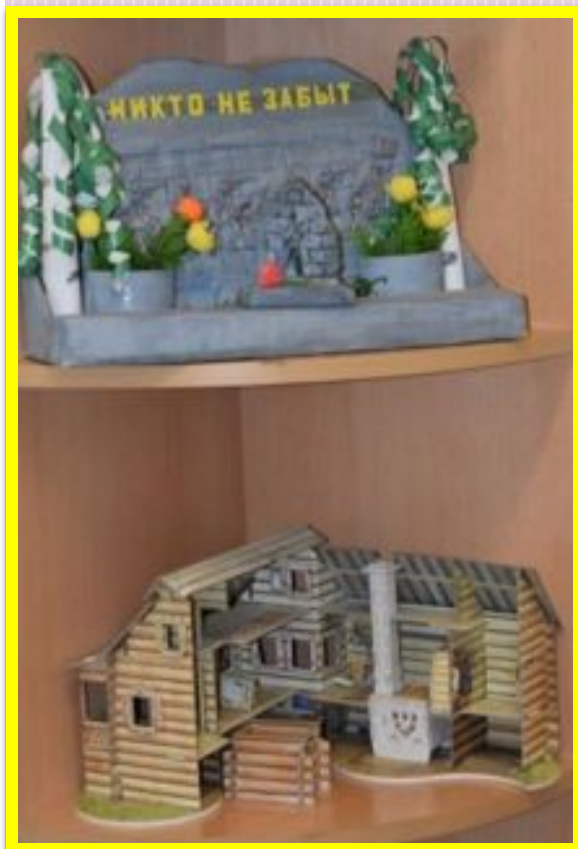
Макеты достопримечательностей города, альбомы с рисунками детей о городе

Организован центр по региональному компоненту , где размещены: государственная символика, информационный и игровой материал о родном крае и городе, достопримечательностях. Дети узнают о народных традициях, знакомятся с микросоциумом (семья, детский сад, родной город).