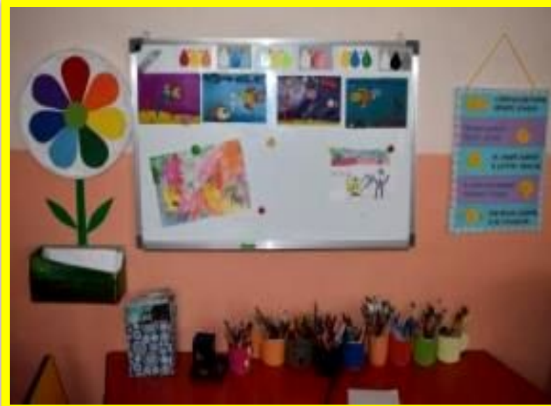
«Стена творчества» для выставки детских работ

В центре творчества «СЕМИЦВЕТИК» мольберты, различные виды бумаги и карандашей, пластилин, глина, ножницы, трафареты, печати, шаблоны, краски, гуашь, восковые и жировые мелки, фломастеры, ножницы, кисти различной величины и жесткости, образцы народно-прикладного и декоративного творчества, соленое тесто, природно-бросовый материал и т.д.