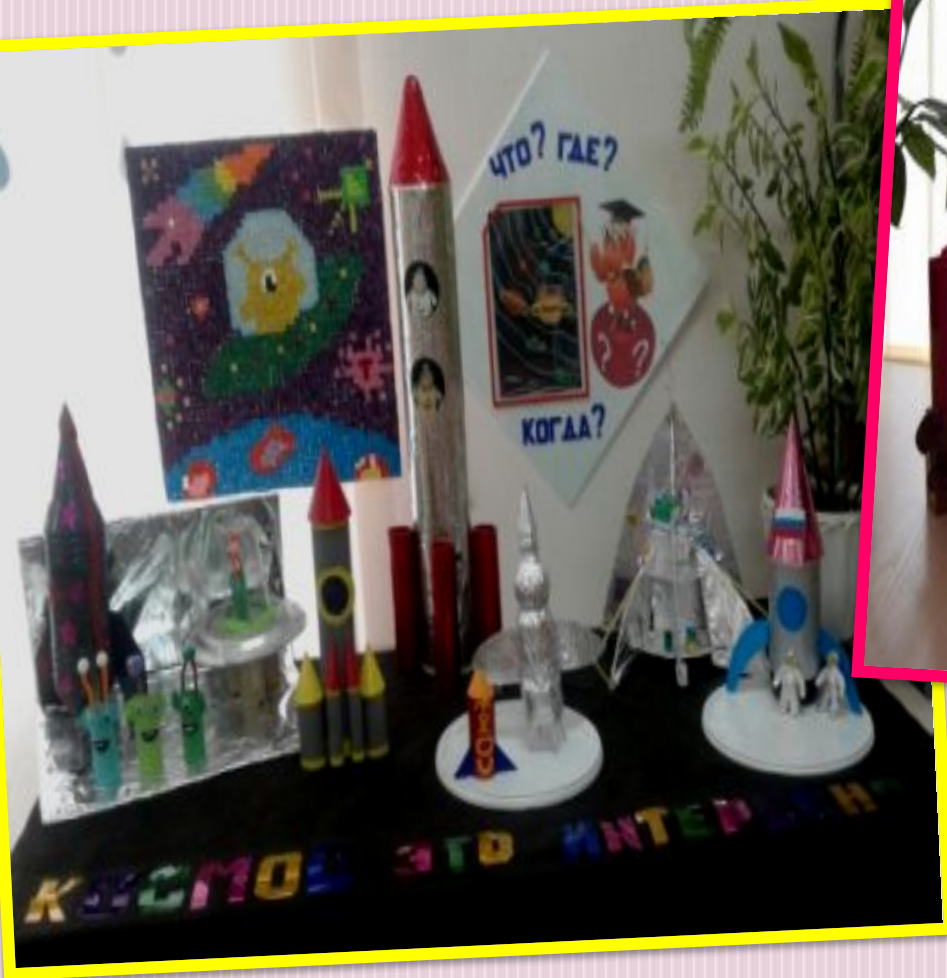
Тема недели «Космос»

Пространство группы условно разделено на центры активности, каждому центру совместно с детьми было придумано название и изготовлен логотип.