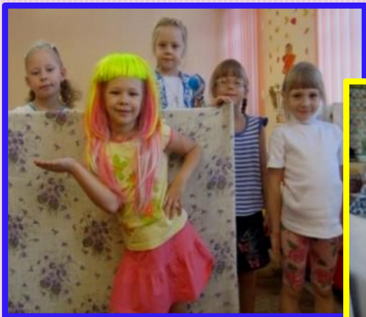
Ролевая игра концерт для кукол по теме недели «Театр»

Театр и уголок для сюжетно-ролевых игр располагается недалеко друг от друга. Элементы костюмов для ряженья, головные уборы, украшения, оборудования для обыгрывания персонажей и ширмы помогают в организации этих пространств.