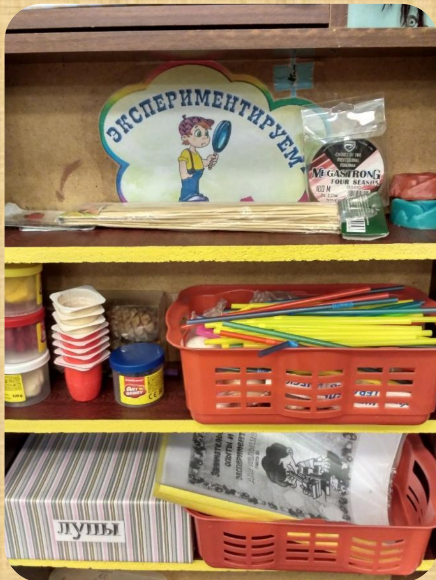
Зона для исследовательской деятельности