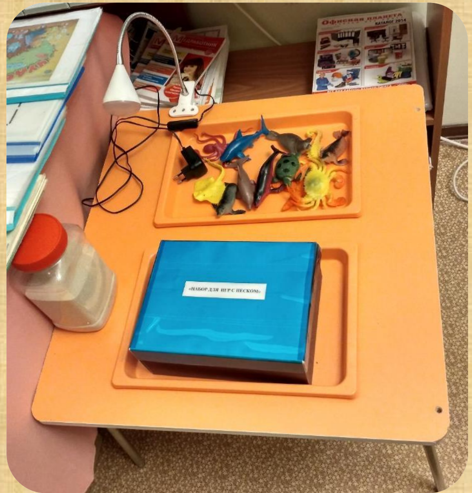
Центр «Вода и песок».