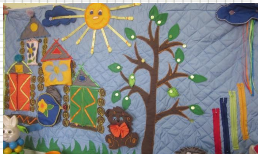
Уголок сенсорного развития

Цель: формирование у детей восприятие отдельных свойств предметов и явлений: формы, цвета, величины, пространства, времени, движений, особых свойств.