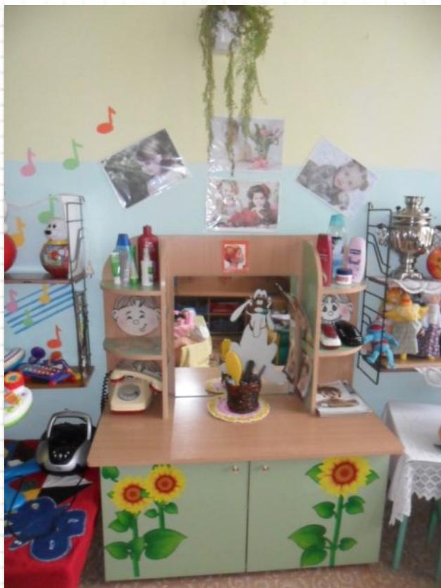
Уголок сюжетно-ролевой игры «Парикмахерская»