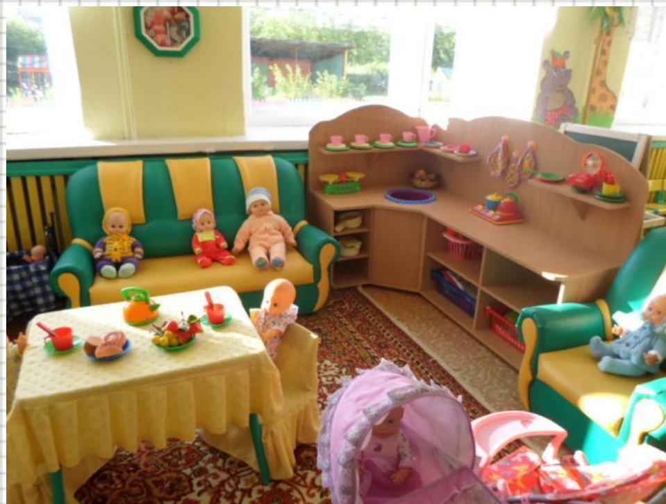
Уголок сюжетно-ролевой игры «Дом»