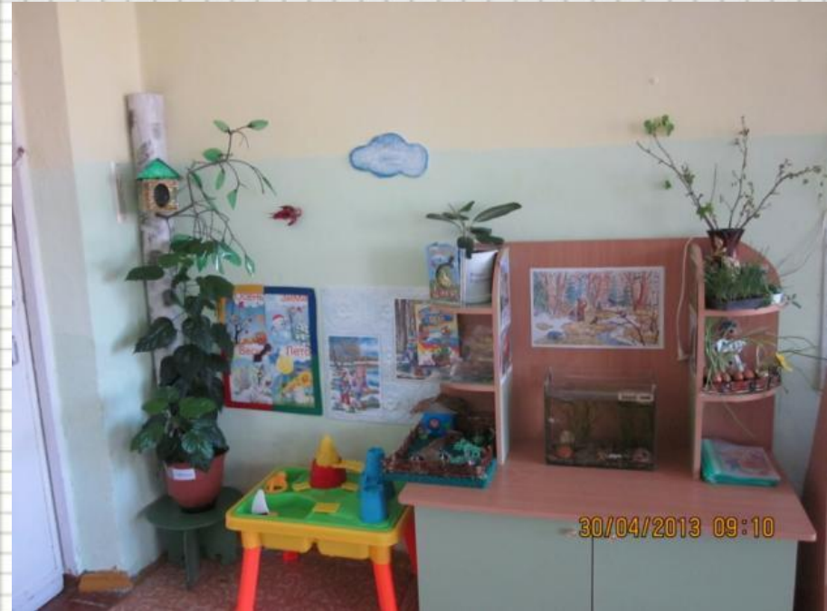
Уголок воды и песка

Цель: сформировать у детей любовь к природе, навыки бережного отношения к ней, эстетическое восприятие явлений.