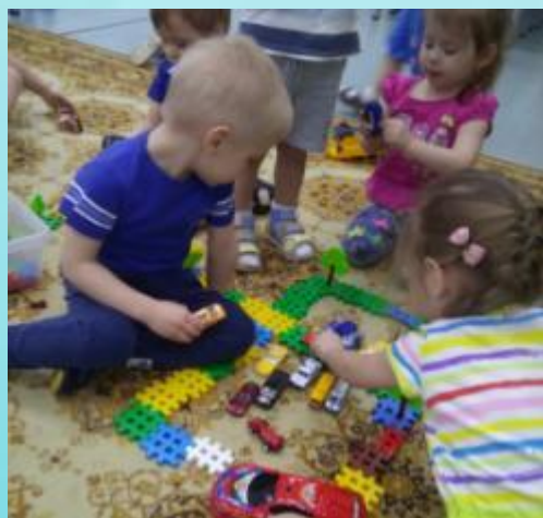
Азбука дорожного движения!