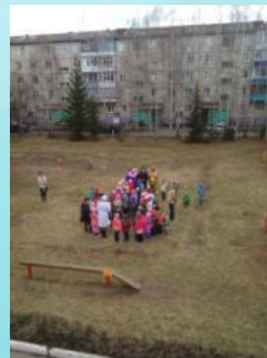
Праздник по ПДД!