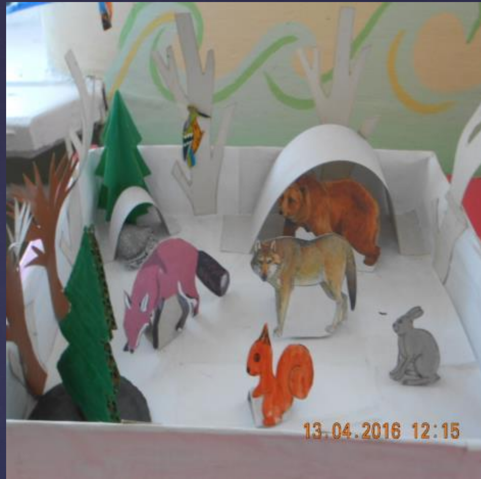
Модели среды обитания животных