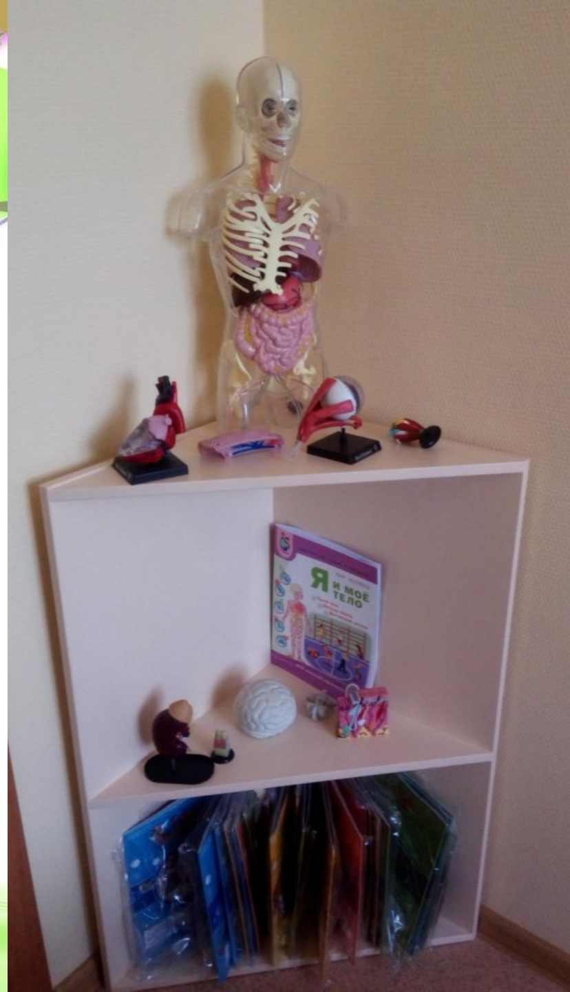
Комната природы и человека