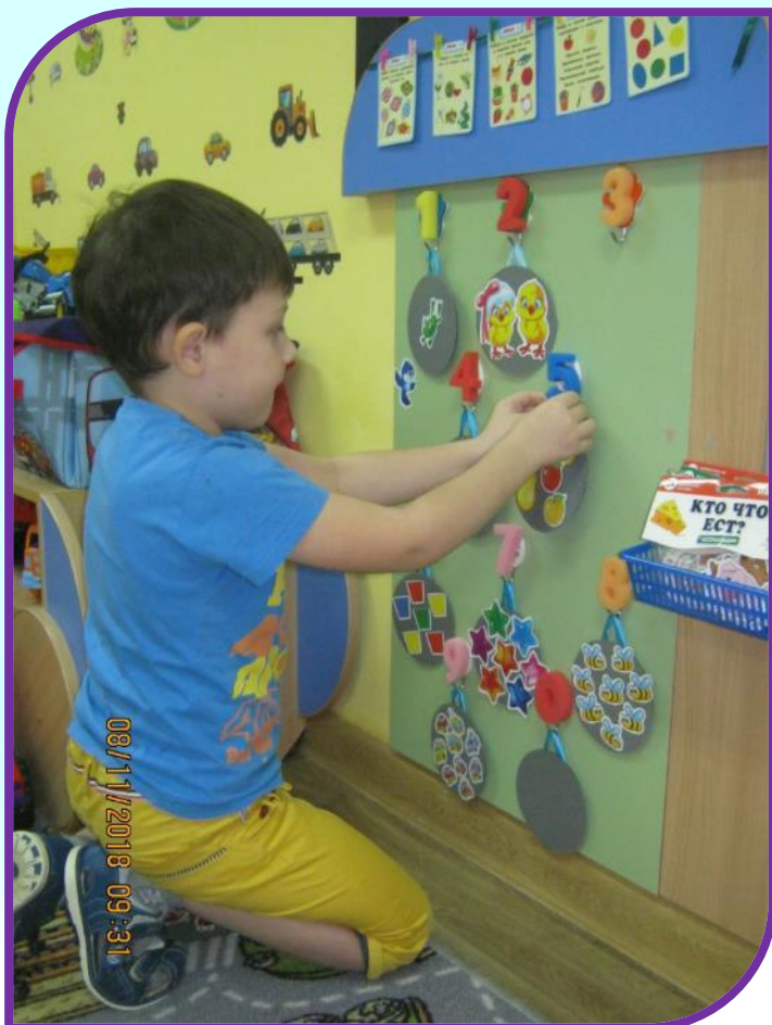
Математика на дисках