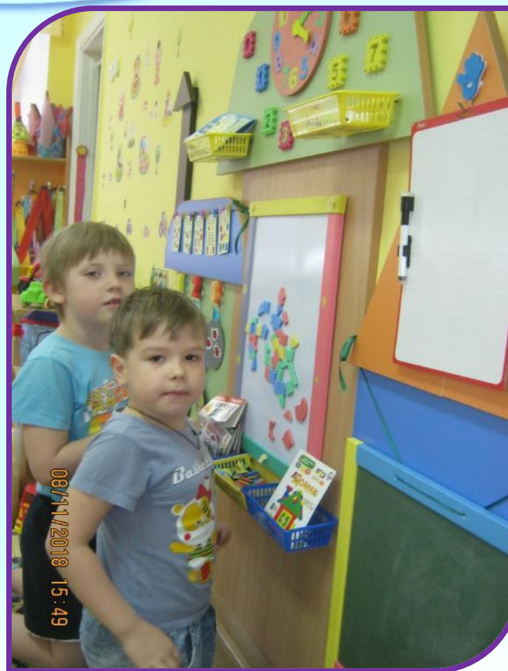
Магнитный конструктор. «Построй домик»