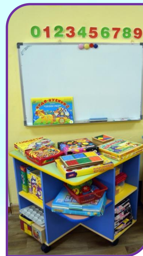
Развивающие настольные игры 2018г.