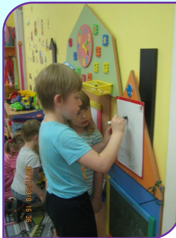
Рисуем на стене