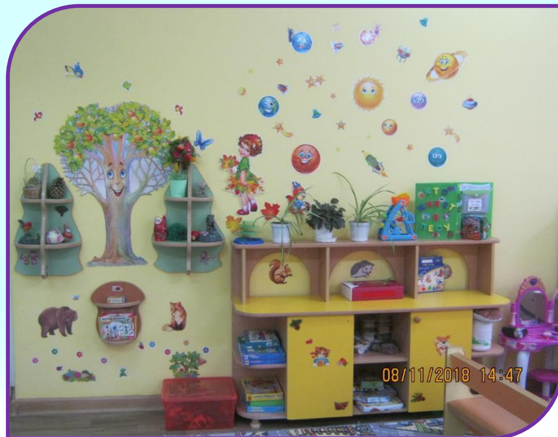
Различные центры развития детских интересов