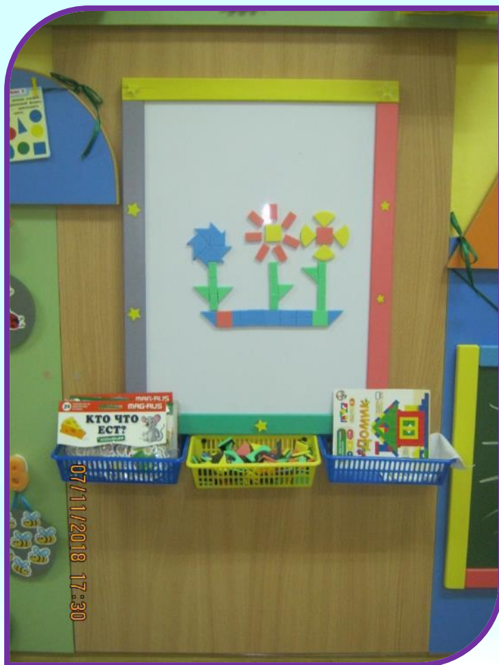
Магнитная доска. Развивающие игры на магнитах.