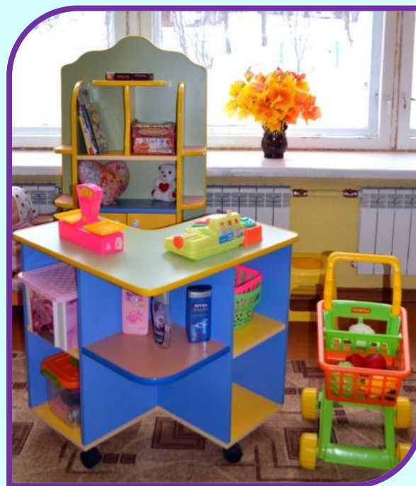
Сюжетно – ролевая игра «Магазин» 2017г.