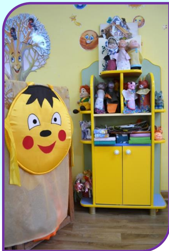
«Театральный уголок» 2018г.