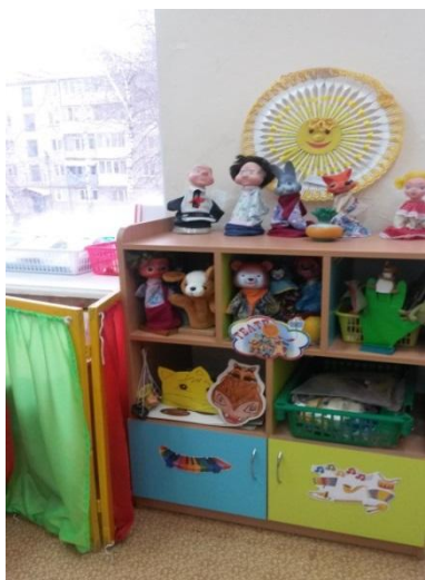
Оборудование для театрализованных игр