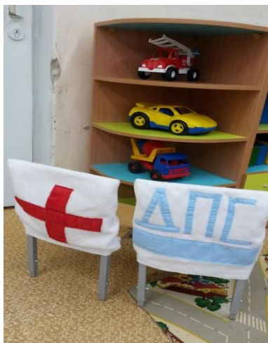
Оборудование для сюжетно-ролевых игр