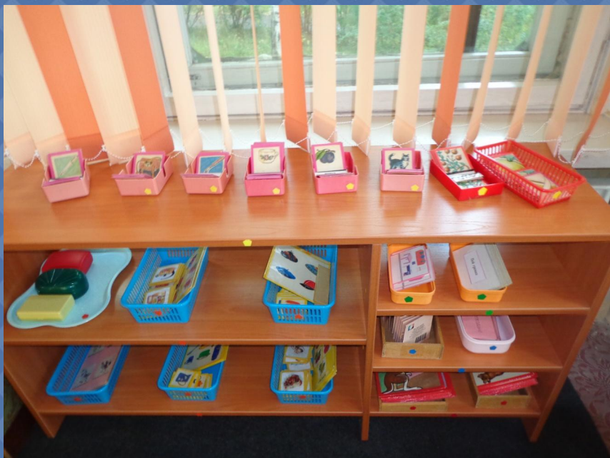
Зона русского языка