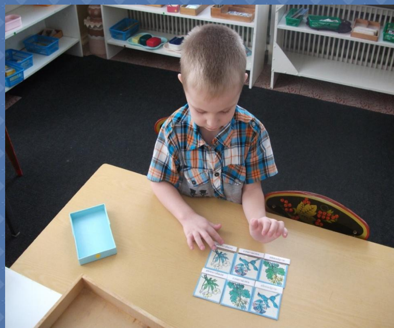
Картинка и слово. Ребенок сравнивает слова и изображение