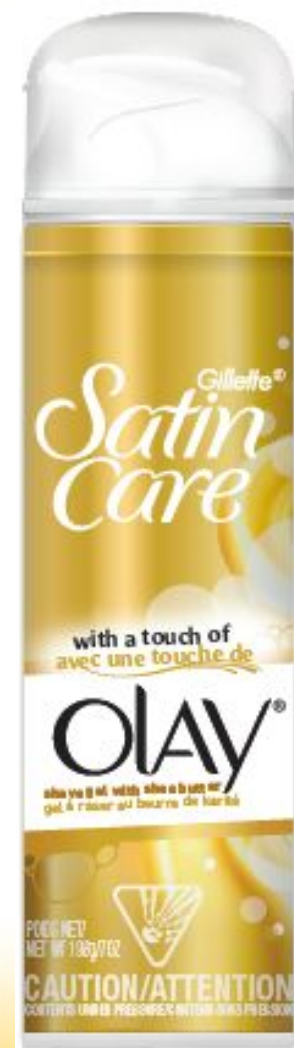
Гель для бритвы 200мл