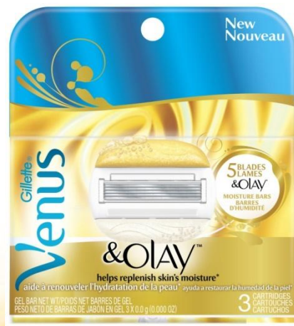
Сменные кассеты x2