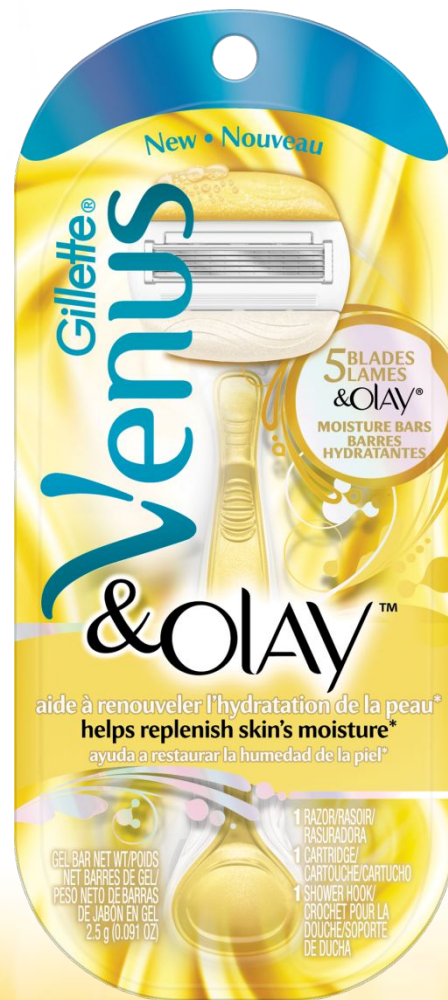
Бритва (ручка + 1 сменный картридж)