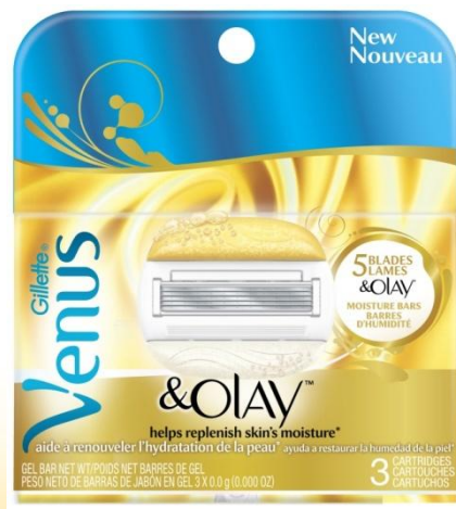
Сменные кассеты x4