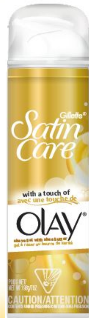
Гель для бритья 200мл