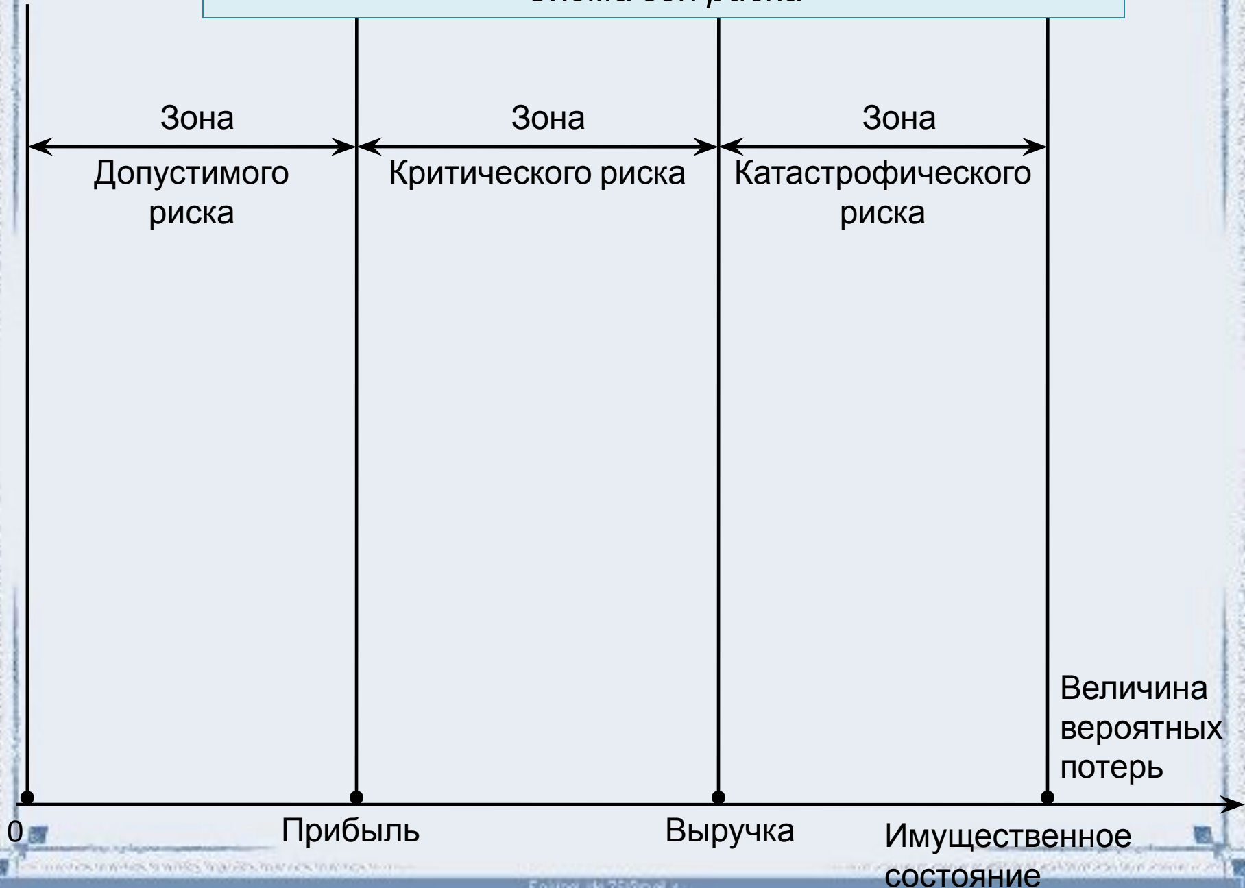
Схема зон риска