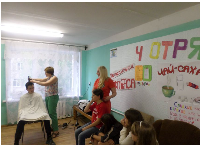
Учебный центр «Элита»