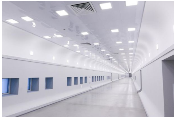
Биофармацевтическая компания Нанолек