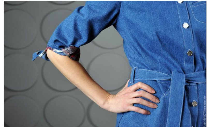
Одежда из натуральных тканей Ивadress