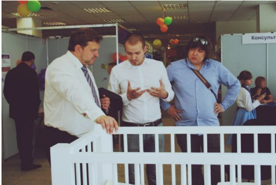
Инновационная детская кроватка (ООО «Русновэро»)