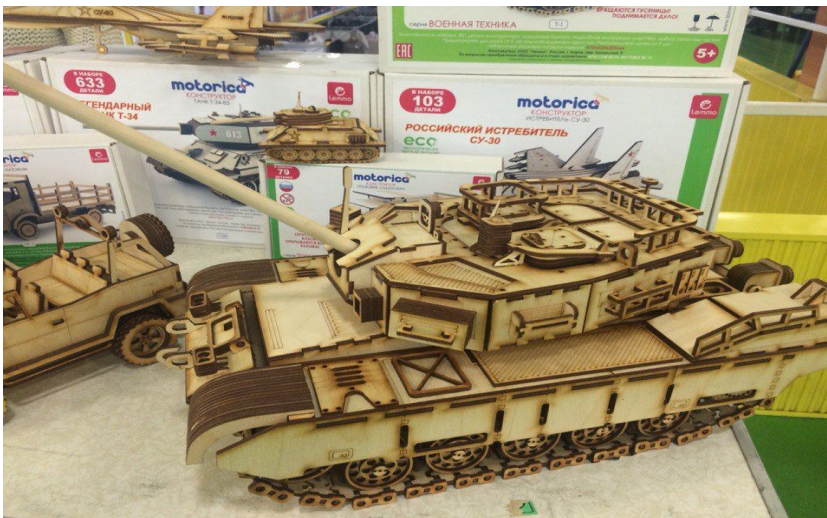
Производство игрушек из дерева Lemto