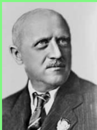
Б. В. Асафьев