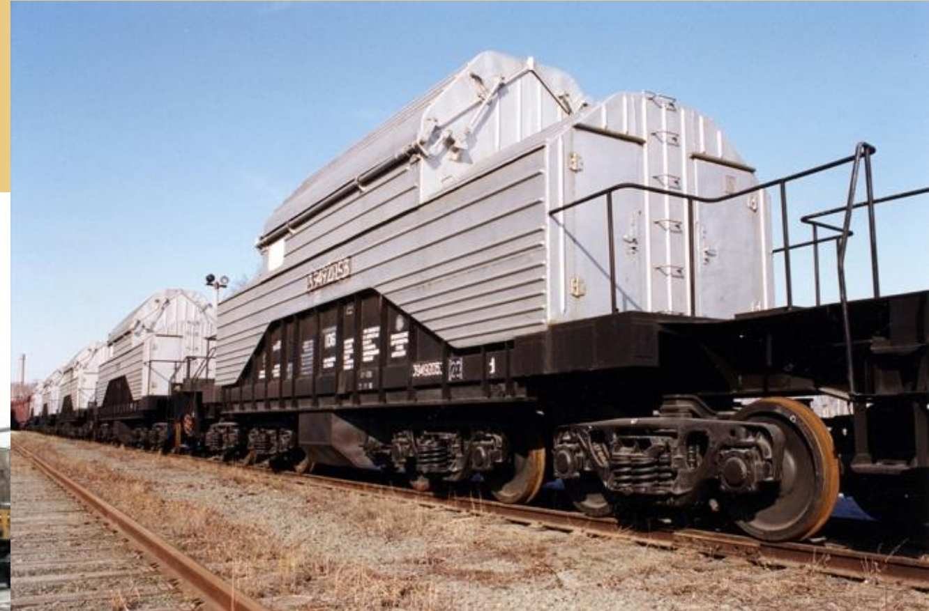
Вагоны для перевозки ядерного топлива