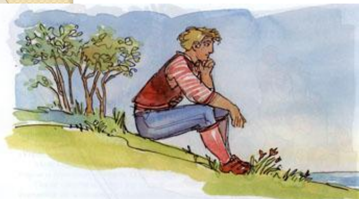
Сюита № 1, соч. 46 Утро