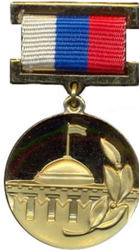
Почётный знак Лауреата премии Правительства Российской Федерации