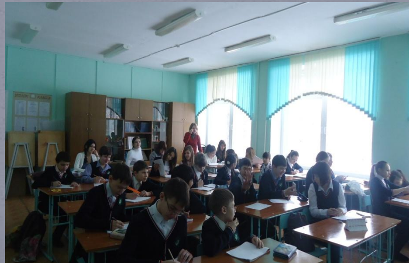
Кабинет изобразительного искусства