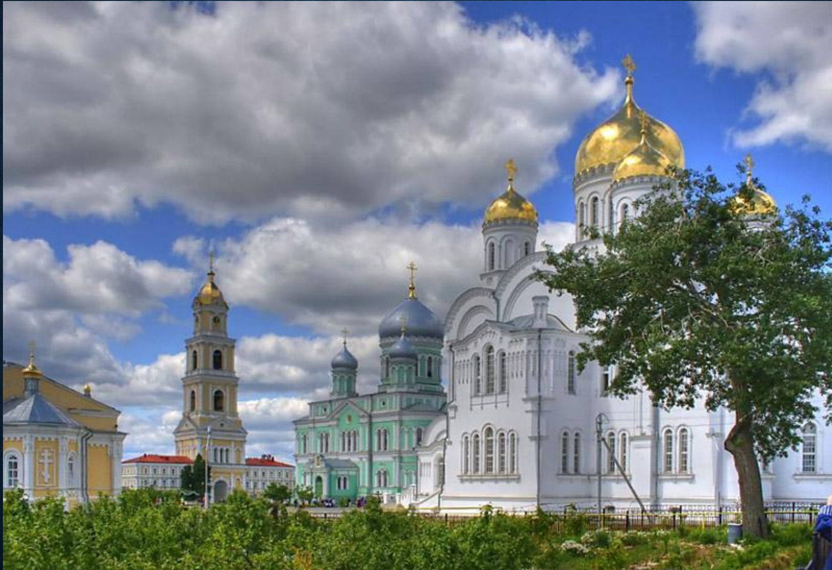
Дивеевская женская обитель