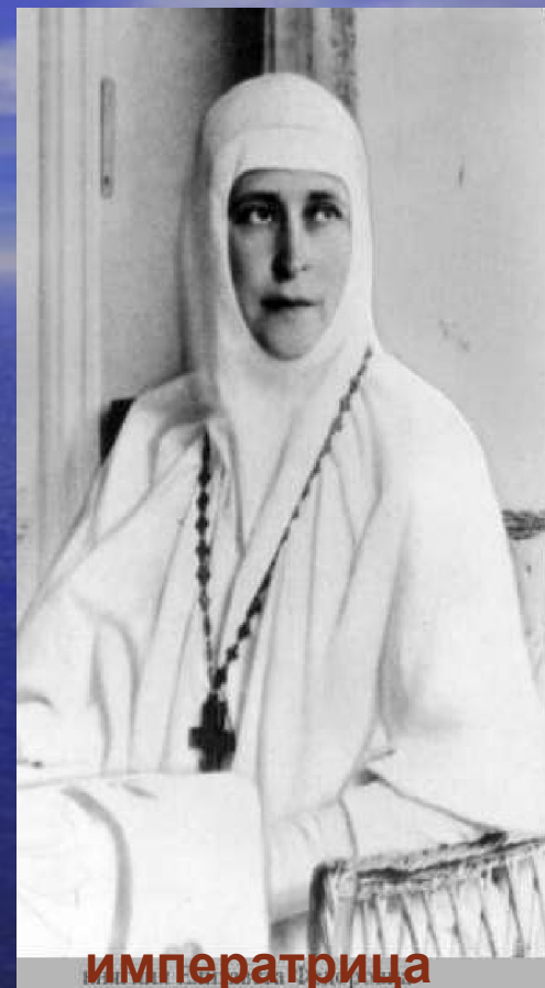
императрица Мария Федоровна

Учредила госпитали в Минске, Киеве, Тифлисе, она приглашает на добровольных началах вдов и направляет их в Санкт-Петербургскую больницу для "прямого назначения как ходить и смотреть за больными". После присяги каждой был вручен особый знак золотой крест, на одной из сторон которого было написано " Сердоболие ". Высокие моральные качества, служение страдающим людям становится традицией русских сестер милосердия.