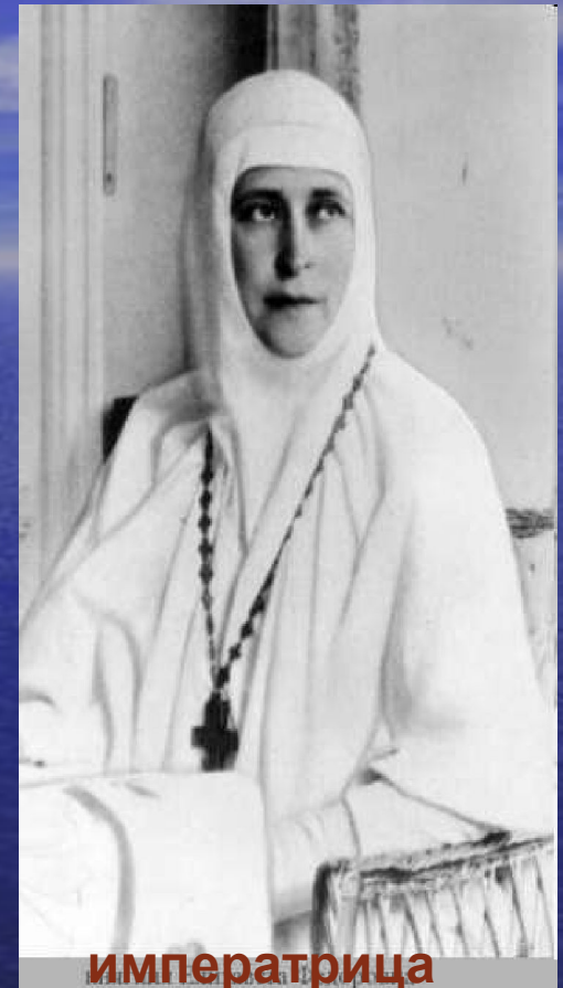
императрица Мария Федоровна

Учредила госпитали в Минске, Киеве, Тифлисе, она приглашает на добровольных началах вдов и направляет их в Санкт-Петербургскую больницу для "прямого назначения как ходить и смотреть за больными". После присяги каждой был вручен особый знак золотой крест, на одной из сторон которого было написано " Сердоболие ". Высокие моральные качества, служение страдающим людям становится традицией русских сестер милосердия.